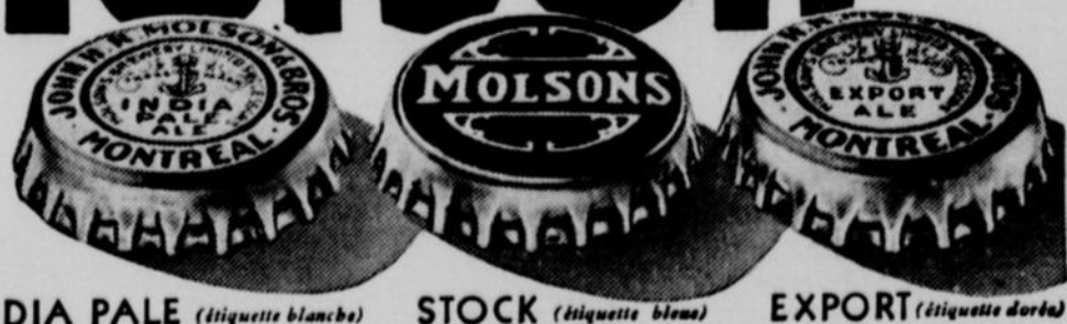
INDIA PALE (étiquette blanche) STOCK (étiquette bleue) EXPORT (étiquette dorée)