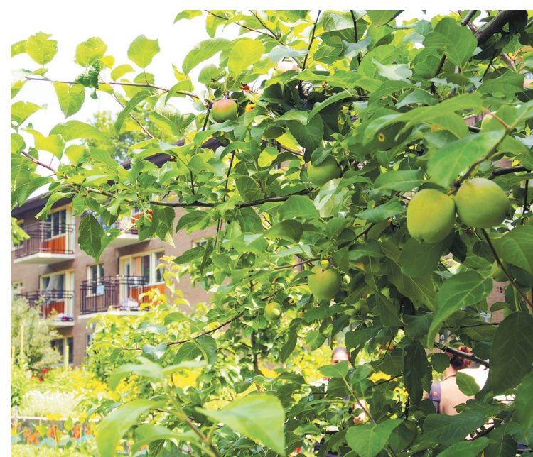
Le terrain des Habitations Jeanne-Mance compte un verger.