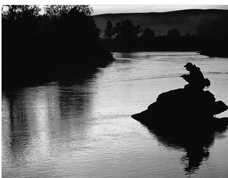
Partie de pêche à la lumière de minuit, en Laponie suédoise