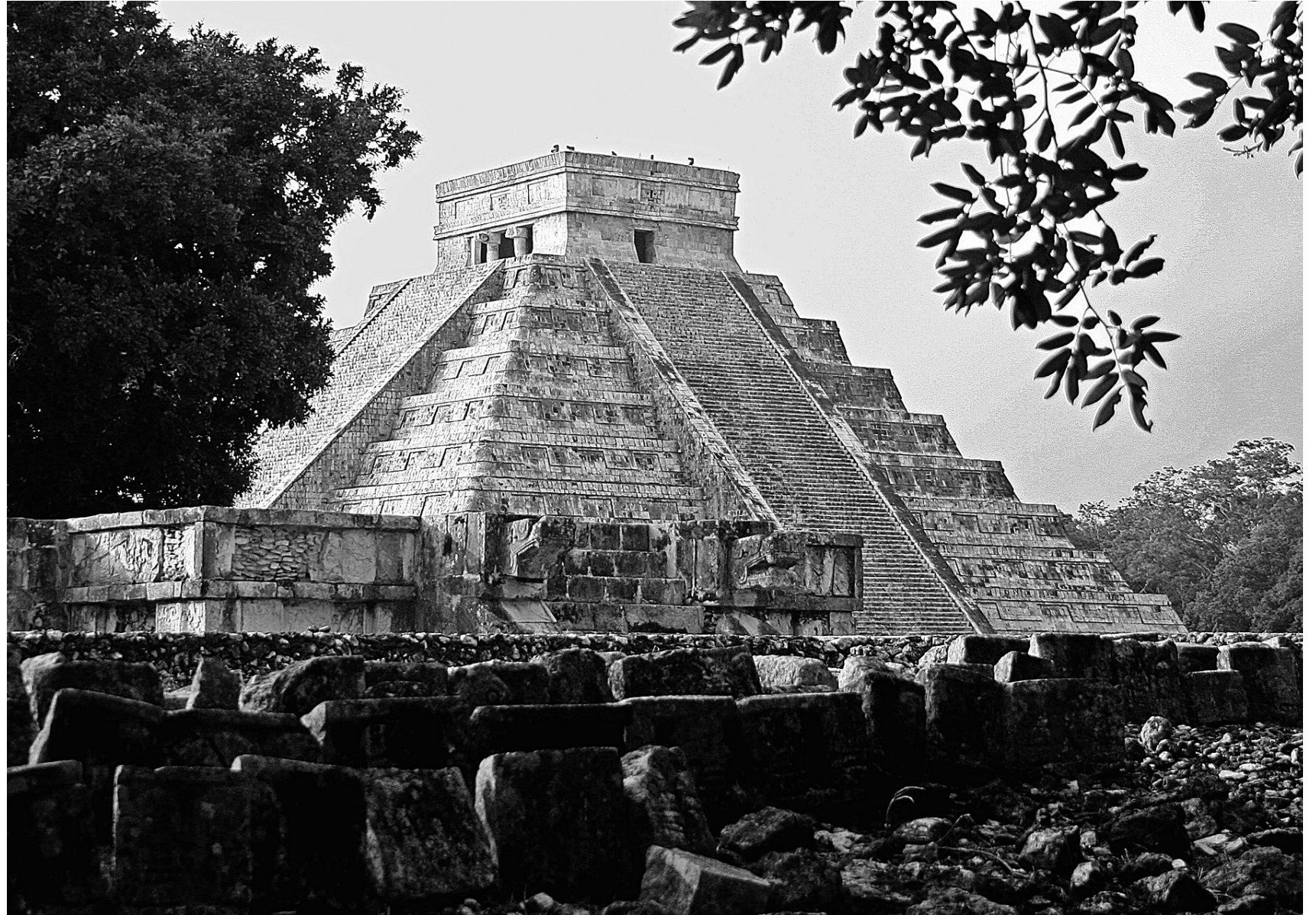
Le Temple de Kukulcan, situé sur le site archéologique de Chichen Itza, dans l'État du Yucatan au Mexique.

Dans le bas pays d'Arromanches, vous avez quelques villages qui sont un peu loin des touristes en mal de débarquement allié de 1944. Vous avez le village de Crépon qui renferme un hôtel-ferme du nom de la Raçonnière. Intérieur très rustique avec des chambres munies de lits à baldaquin. Le petit-déjeuner est servi dans les chambres ou dans une grande salle de séjour devant une immense