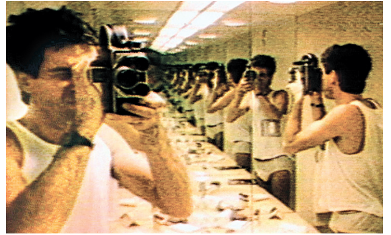
Une scène de Yes Sir! Madame... , de Robert Morin (fiction, 16mm et vidéo, 75 minutes, couleur, 1994)