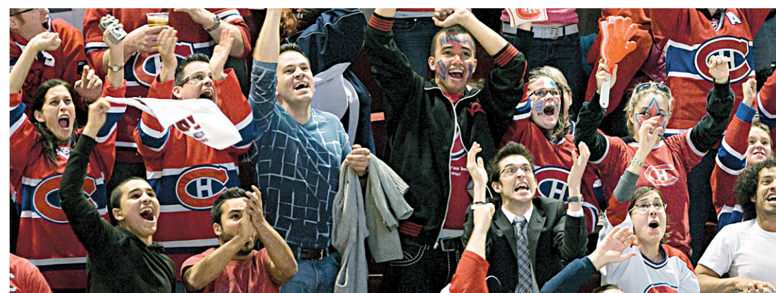
Les fans du Canadien ont été surpris de la performance de leurs favoris.