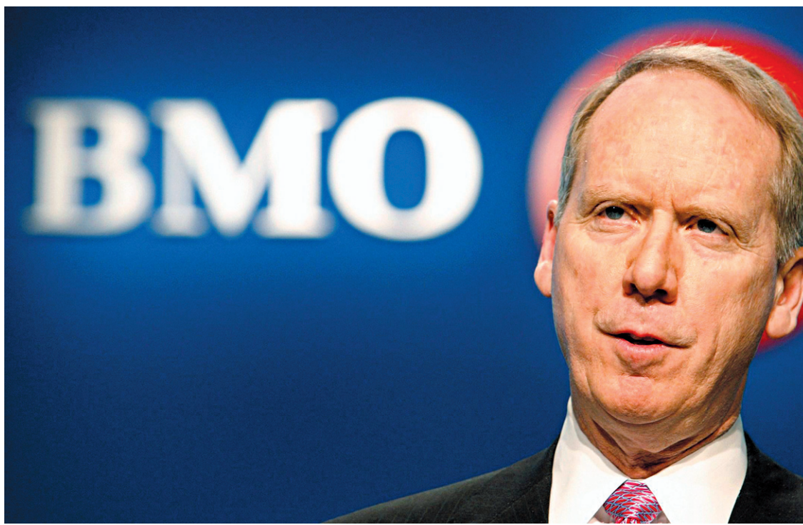
Bill Downe, chef de la direction de la Banque de Montréal

Comme prévu, la banque a réduit ses provisions pour pertes sur prêts au plus récent trimestre, ce qui a contribué à la hausse des profits. La provision pour mauvaises créances a été réduite de 123 millions par rapport à l'an dernier, pour se chiffrer à 249 millions pour la période de trois mois terminée le 30 avril. «Même si le déclin des provisions pourrait ralentir dans