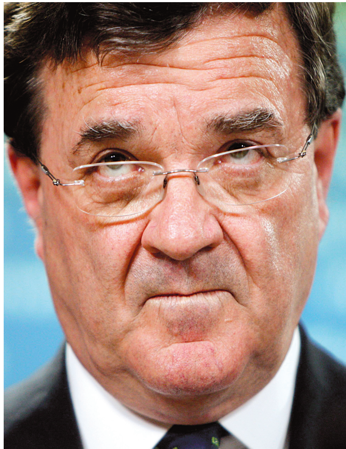
Le ministre fédéral des Finances, Jim Flaherty, a déposé hier son projet de loi pour créer une commission nationale des valeurs mobilières. Son homologue québécois, Raymond Bachand, s'est empressé de dénoncer ce qu'il considère être une intrusion du gouvernement central dans les affaires des provinces.

Flaherty dépose son projet de loi qui irrite le Québec