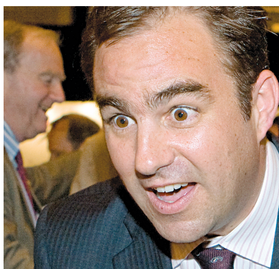
Geoff Molson était l'invité de la Chambre de commerce de Montréal hier midi.