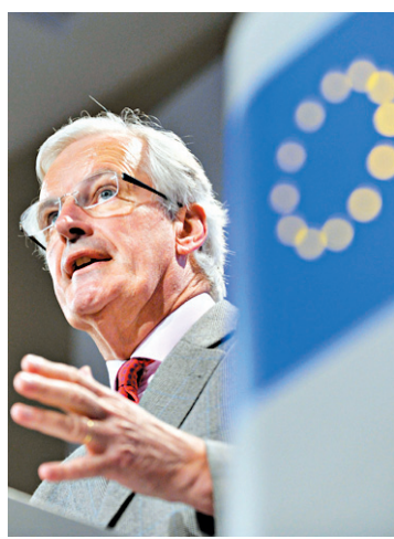
Michel Barnier, commissaire européen en charge des services financiers

posent déjà des prélèvements à leur secteur bancaire ou envisagent de le faire. La Suède notamment a introduit un prélèvement de 0,036 % sur le passif des banques, pour les faire par-