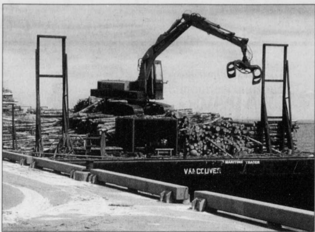
COLLABORATION SPÉCIALE, GILLES GAGNÉ

Des usines de sciage de la Baie-des-Chaleurs transformeront encore cette année une partie du bois coupé à l'Île d'Anticosti. Produit forestier Saint-Alphonse, une filiale de Rexfor, sciera les billes de trois des quatre débarquements effectués au quai de Paspébiac au cours des deux dernières semaines. Chaque barge contient de 3500 à 5000 mètres cube de bois. La part de l'usine de Saint-Alphonse s'établira à 15 800 mètres cube. L'Association coopérative forestière de Saint-Elzéar a pris livraison du tiers de ce volume environ. Depuis deux ans, c'est essentiellement l'usine de GDS à Pointe-à-la-Croix qui avait acheté du bois d'Anticosti. G.G.