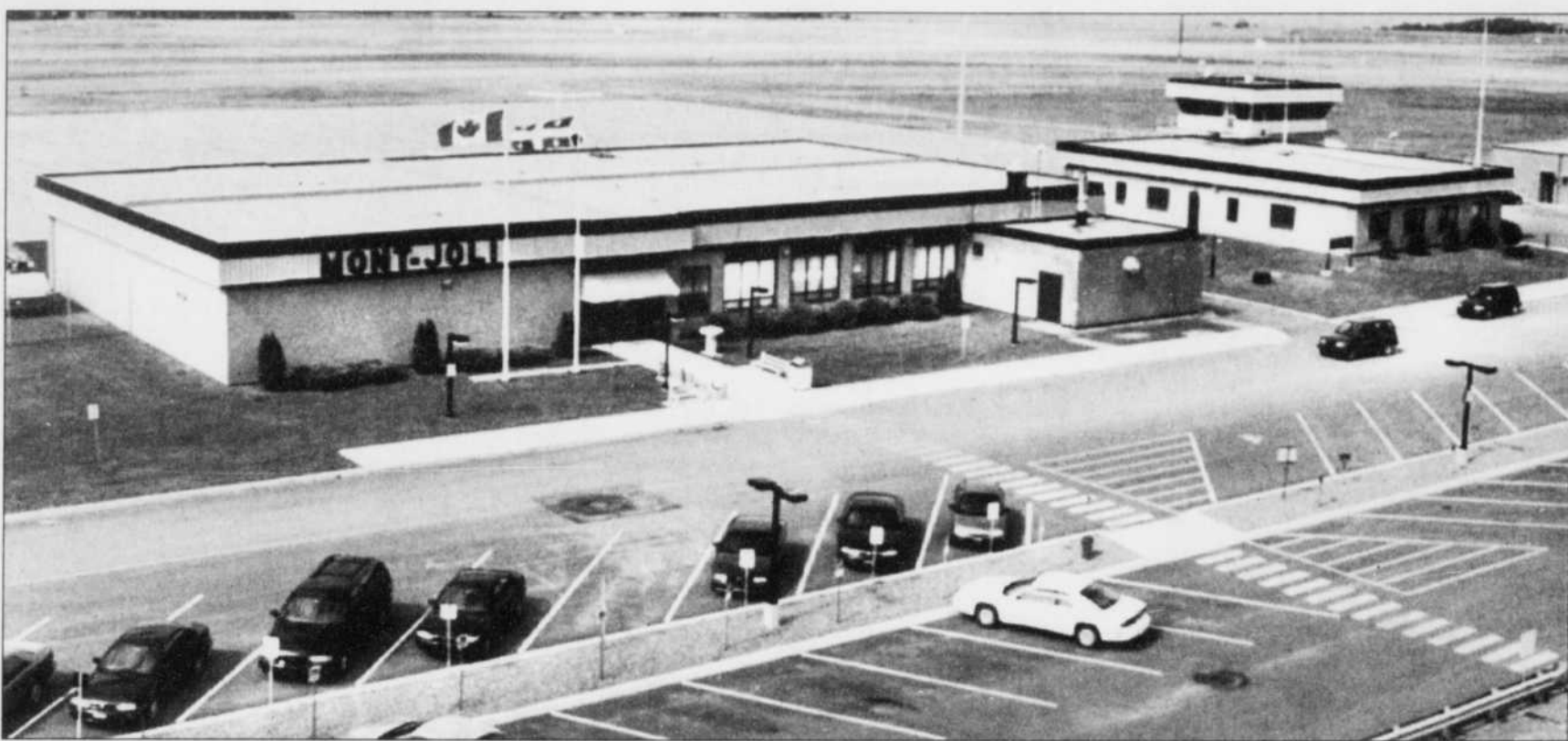
La municipalité de Mont-Joli a commandé une étude avant de bouger dans le dossier de la privatisation de l'aéroport, qui doit être réalisée d'ici le 31 décembre 1999.