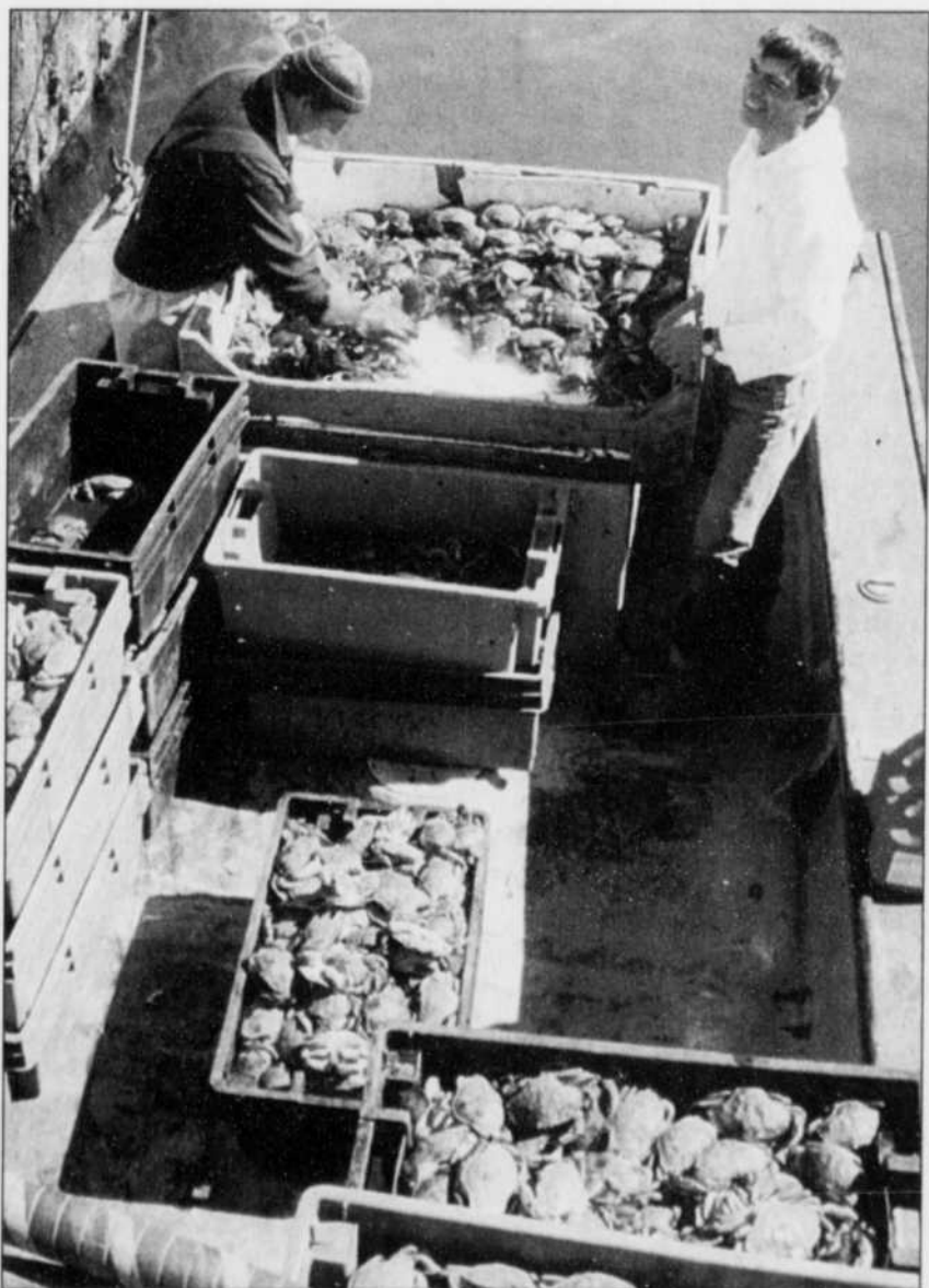
Le crabe est, cette année, dans un creux de son cycle biologique, une situation temporaire. Pour aider les travailleurs d'usine à passer cette période, Québec a débloqué des fonds pour mettre sur pied des corvées communautaires.

La municipalité de Mont-Joli a commandé une étude sur un plan d'affaires avant de bouger dans le dossier de la privatisation de l'aéroport qui doit être réalisée d'ici le 31 décembre 1999.