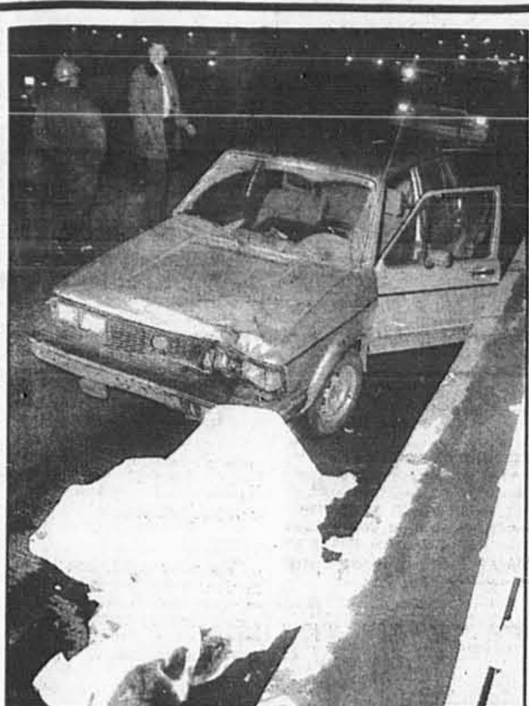
Un piéton a été tué par une voiture alors qu'il traversait le boulevard Métropolitain en fin de soirée, vendredi.

Il existe actuellement des solutions technologiques fiables et efficaces pour disposer des huiles usées. On peut les brûler à haute température dans les cimenteries, ou les recycler pour les revendre. Selon M. Dubé, il ne manque que la volonté politique de les appliquer.