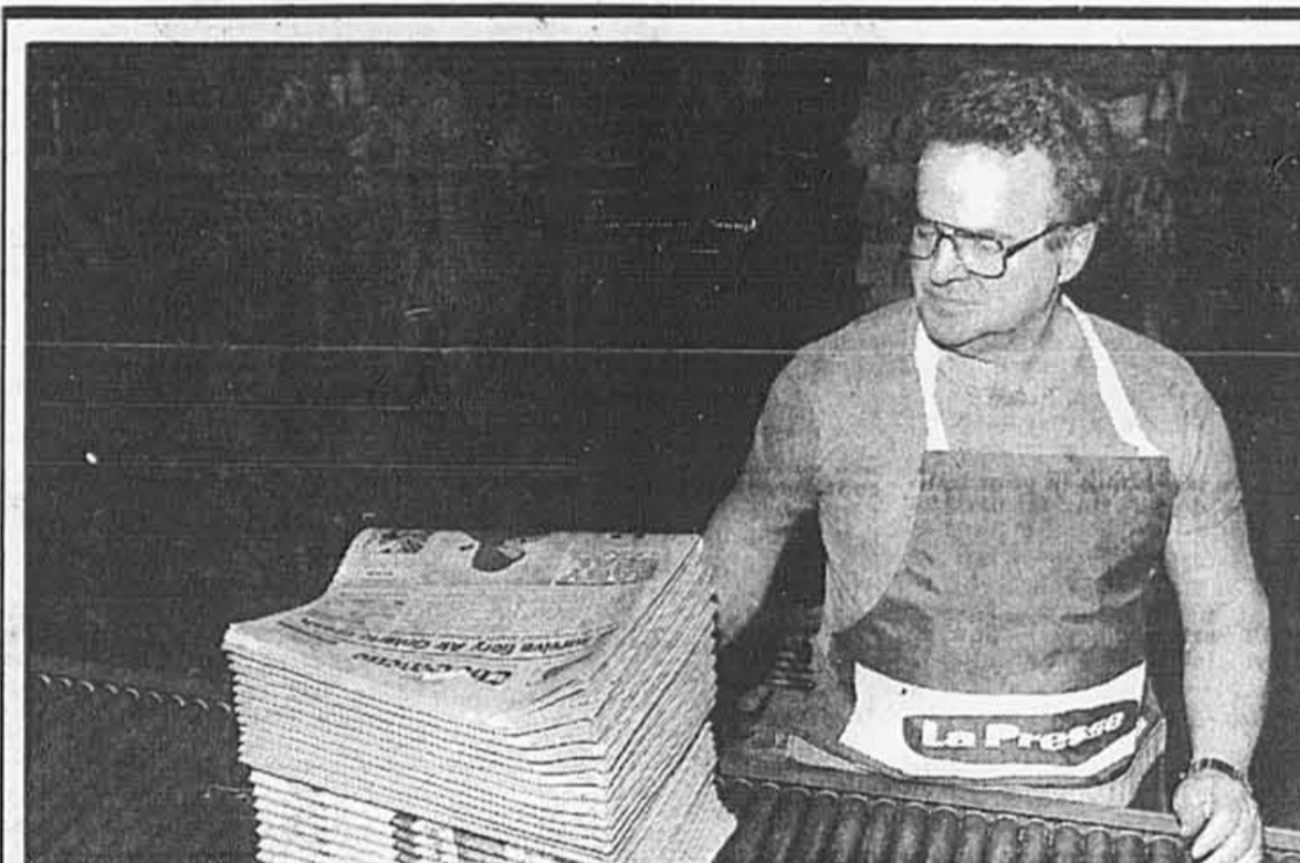
Un employé de l'expédition de La Presse dirige une pile d'exemplaires de The Gazette vers les chutes menant aux camions de livraison. La Presse a imprimé 184 000 exemplaires du quotidien anglophone hier soir, à la suite d'une interruption du courant électrique au journal The Gazette.