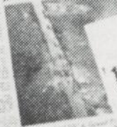
STRIKERS YIELD AS POLICE AID ARRIVES Long Day of Bloodshed Is Ended