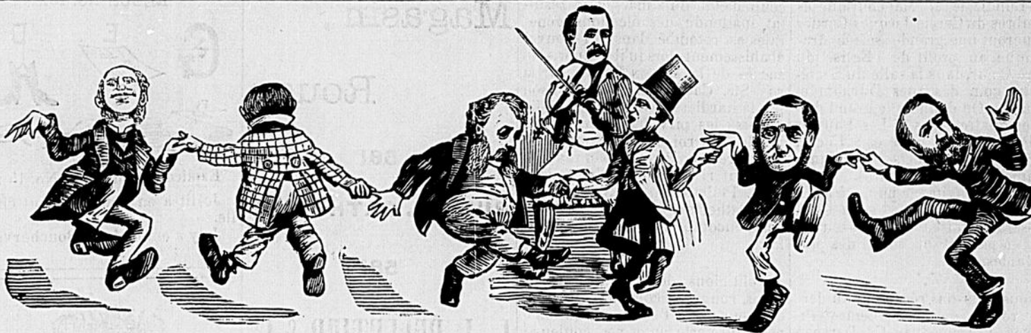
LA DANSE MINISTERIELLE.