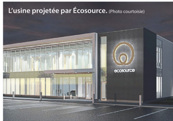
L'usine projetée par Écosource.

Écosource recyclage prévoit investir 13 M$ pour sa mise en place. L'usine totalisera 40 000 pieds carrés et sera équipée d'un