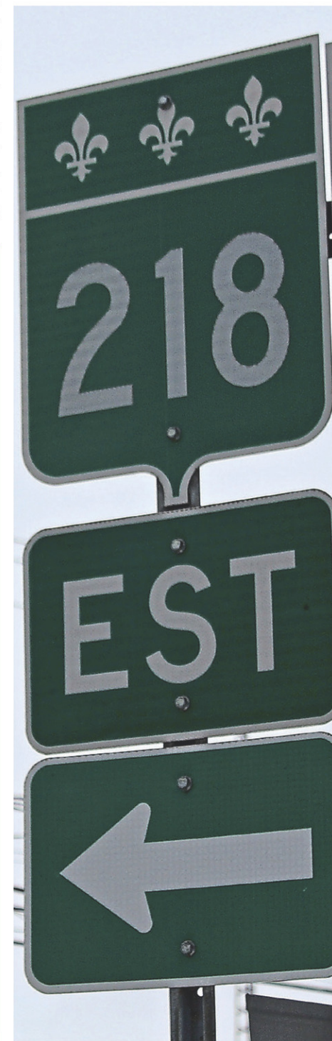
La zone industrielle devait border la route 218.

Plus les voix seront nombreuses, meilleur sera le portrait! Les résultats seront dévoilés ce printemps.