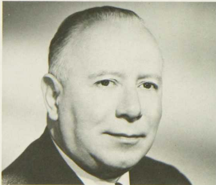
Louis Seigner (Photo datant de quelques années)