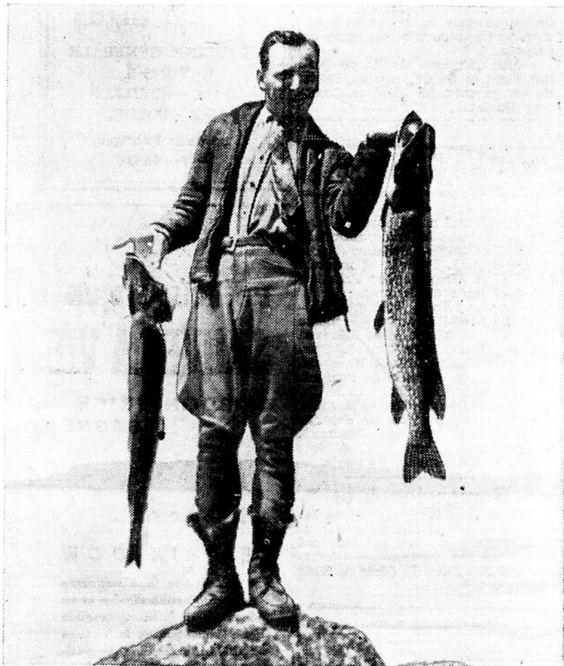
Deux qui ne se sont pas échappés