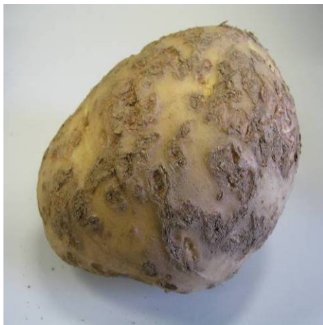
Photo : Symptômes de gale commune

Les agents pathogènes responsables de la gale commune sont des bactéries appartenant au genre des Streptomyces . Il s'agit de bactéries saprophytes, se nourrissant de matière organique en décomposition, qui ont la capacité de produire des antibiotiques. Elles se reproduisent via la production de spores pouvant survivre dans le sol durant une longue période (plus de 10 ans), et ce, même en l'absence de pommes de terre. Plusieurs espèces de Streptomyces sont présentes dans les sols et la majorité ne sont pas phytopathogènes. Au moins 7 espèces de Streptomyces ont été reconnues pour causer la gale commune dont : S. scabiei , S. acidiscabiei , S. turgidiscabiei , etc. Toutefois, l'espèce dominante demeure S. scabiei et de nombreuses souches de cette espèce ont été identifiées avec des niveaux de virulence pouvant varier entre elles.