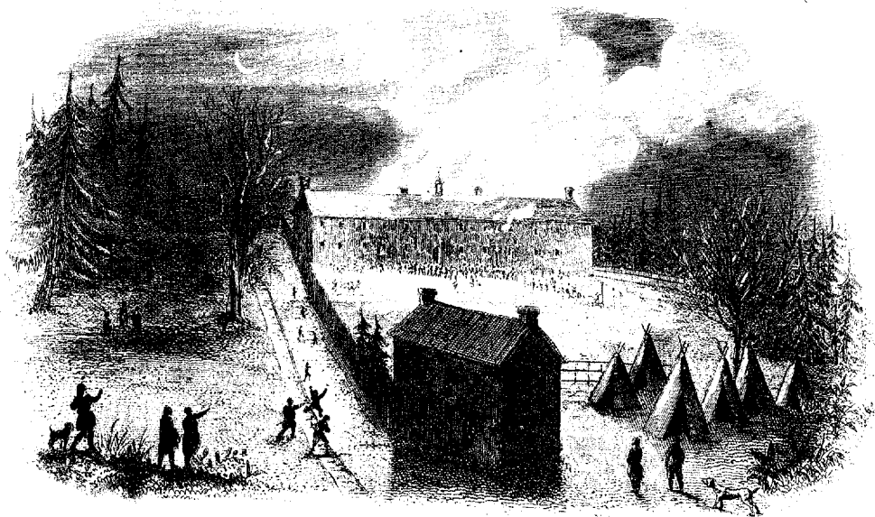
INCENDIE DU PREMIER MONASTÈRE. (1650.)