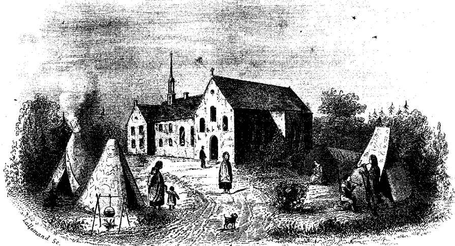
ÉGLISE ET PENSIONNAT DU SECOND MONASTÈRE bâti en 1651 brulé en 1686