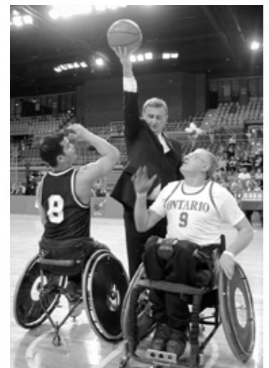
Défi sportif 2001