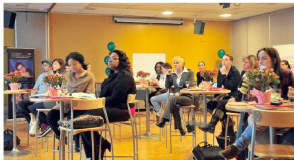
Le public était visiblement attentif lors des présentations.