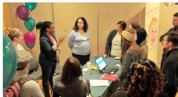
Des représentantes du comité jeunesse du CII partagent leurs expériences avec les participants.