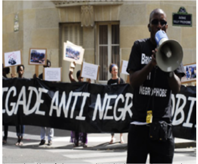
Source : http://www.foulexpress.com/2012/09/massacre-des-mineurs-de-marikana-en-afrique-du-sud-un-racisme-detat/

Le musulman demeure un être saisissable lorsqu'il est identifié à une même appartenance politique et que sa pratique religieuse demeure de l'ordre du privé. Les dernières décennies ont en revanche introduit une thèse plus dramatique du fossé grandissant entre les