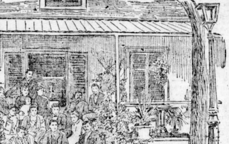
L'ancienne résidence de M. Mercier, à Montréal, rue St Denis.

La manifestation que les amis de feu l'honorable M. Mercier feront demain au cimetière de la Côte des Neiges, aura un caractère de solennité et d'émotion que ne s'attendant pas d'abord.