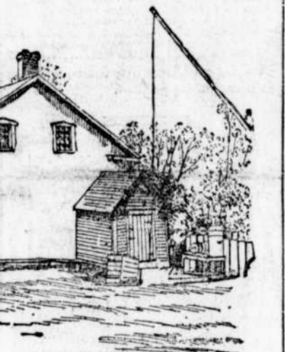
Les dépendances de Tourouvre au moment où M. Mercier y ramène la faucheuse avec laquelle il aimait à s'employer aux champs.

Les prix des produits, diminuer les salaires et créer le chômage. Si les produits du travail étaient cotés moins haut, ils s'écouleraient davantage et la demande étant plus forte, le besoin d'en créer de nouveaux serait plus facile à satisfaire.