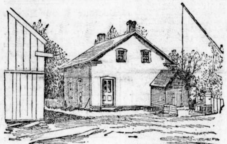
La maison paternelle de M. Mercier, à St Athanase d'Iberville, en face de St Jean. C'est là que s'est écoulée la jeunesse de M. Mercier jusqu'à l'âge de 14 ans.