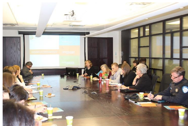
Lancement du 6e Rapport international

Le 6e Rapport international a été présenté pour la première fois lors d'une mini-conférence qui a eu lieu le jeudi 22 novembre 2018 à Montréal, dans les bureaux de Montréal International.