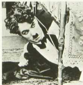
«Une vie de chien», «Charlot, soldat», «Le Pèlerin», moyens métrages réalisés et interprétés par Charlie Chaplin.