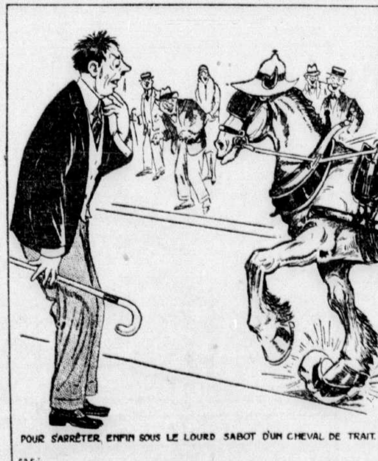
POUR S'ARRÊTER, ENFIN SOUS LE LOURD SABOT D'UN CHEVAL DE TRAIT.