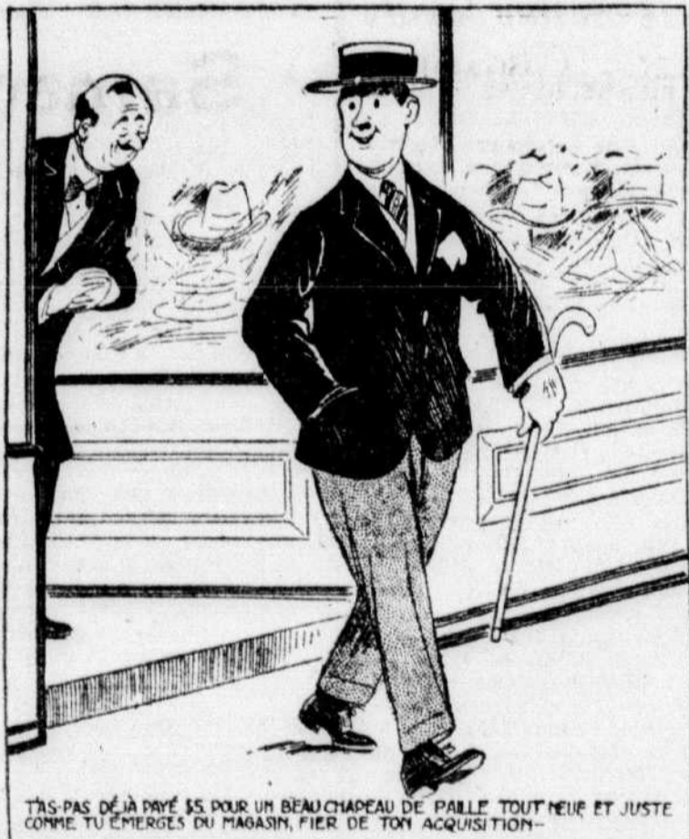
T'AS PAS DÉJÀ PRÉVU POUR UN BEAUCHAPEAU DE PAILLE TOUT NEIGÉ ET JUSTE COMME TU ÉMERGES DU MAGASIN, PIÈRE DE TON AGRÉSSION?