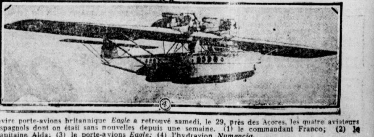
Le navire porte-avions britannique Eagle a retrouvé samedi, le 29, près des Açores, les quatre aviateurs espagnols dont on était sans nouvelles depuis une semaine. (1) le commandant Franco; (2) le capitaine Alda; (3) le porte-avions Eagle ; (4) l'hydravion Numancia .