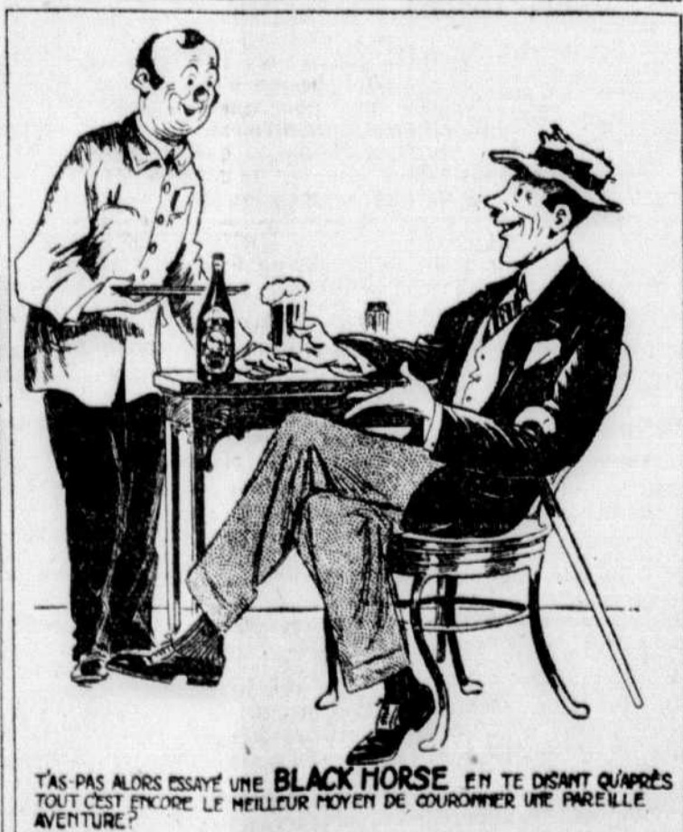
T'AS PAS ALORS ESSAYÉ UNE BLACK HORSE EN TE DISANT QU'APRÈS TOUT C'EST ENCORE LE MEILLEUR MOYEN DE GOURMENER UNE PAREILLE AVENTURE?

dites simplement - "Bière Black Horse Dawes s.v.p.!"