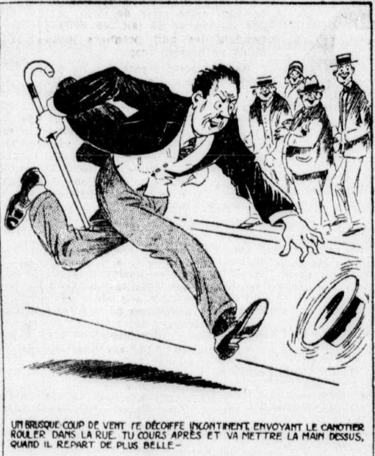
UN BRÉSQUE COUP DE VENT TE DÉCOFFE ENLANTINEMENT ENVOYANT LE CANOTIER ROLLER DANS LA RUE. TU COURS APRÈS ET VA METTRE LA MAIN DESSUS, QUAND IL REPART DE PLUS BELLE.