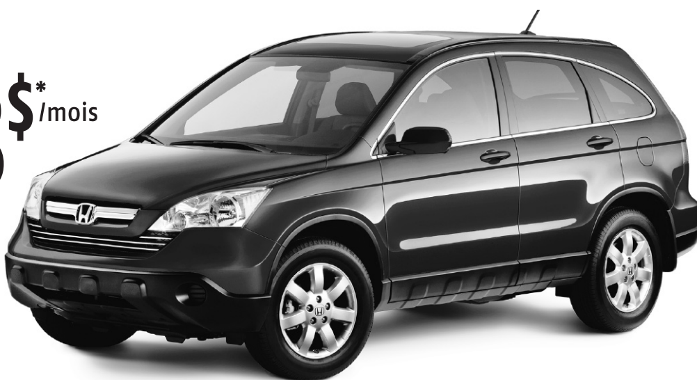
Cr-V LX 2008 • 7,3 L/100 km