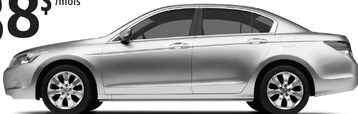
Berline Accord LX 2008 • 6,4 L/100 km

OU Bénéficiez de remises à l'achat allant jusqu'à