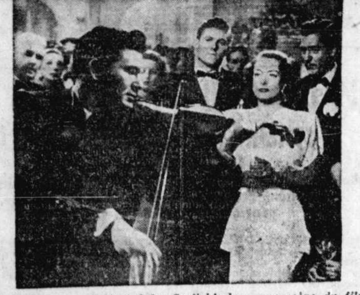
Voici Joan Crawford et John Garfield dans une scène du film musical "Humoresque" dont le Champlain présentera, à partir de samedi prochain, en exclusivité, la version française.

Londres, 13 (C.P.) — Une exposition de peintures et sculptures provoque en ce moment à Londres de nombreux sarcasmes de la part des critiques d'art attitrés. Il s'agit de la collection de 437 oeuvres établie grâce à un don fait il y a plus de 70 ans par Sir Francis Chantrey, lui-même peintre alors assez connu. On reproche à cette collection de comprendre un beaucoup plus grand nombre de toiles et de marbres ayant une valeur pu-