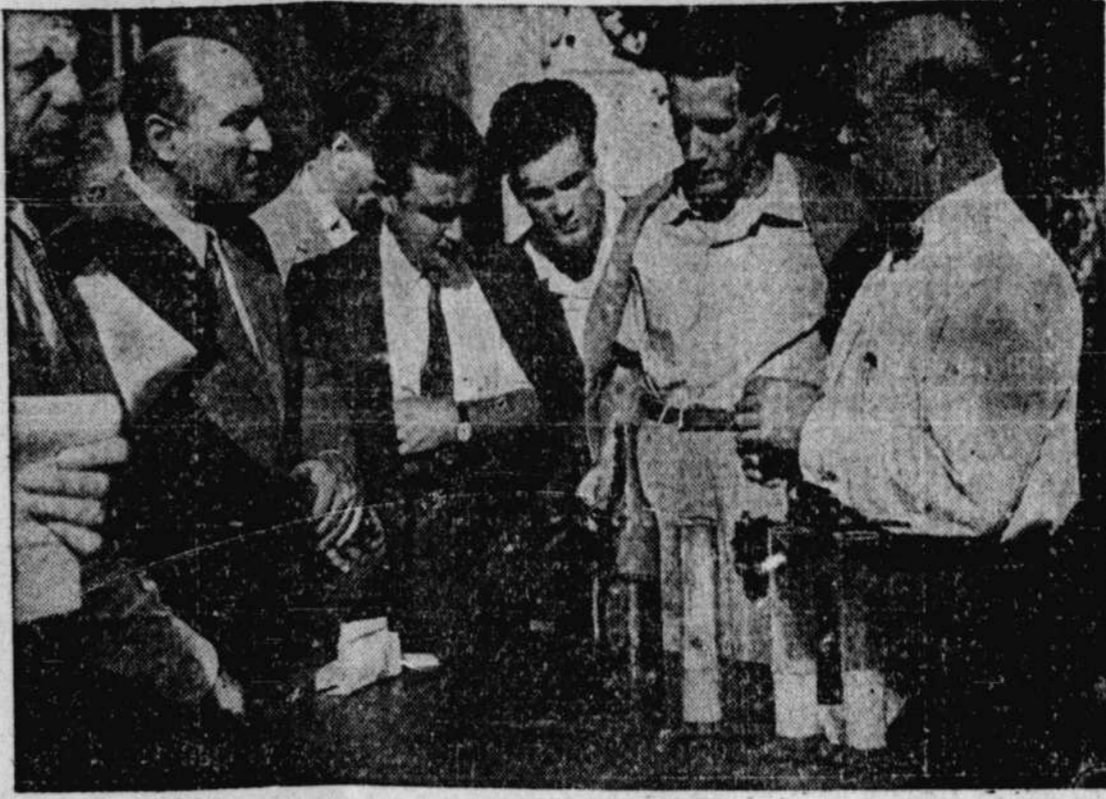
Les experts et les Gouvernements de divers pays attaquent les problèmes anciens au moyen de méthodes nouvelles grâce aux programmes d'aide technique fournis par l'O.N.U., et les agences spécialisées reliées à l'Organisation. On voit ci-dessus des savants italiens en train de s'initier aux méthodes les plus récentes pour combattre la destruction des grains par les insectes et la moisissure, dans une école dirigée par l'Organisation pour l'alimentation et l'agriculture des Nations-Unies.