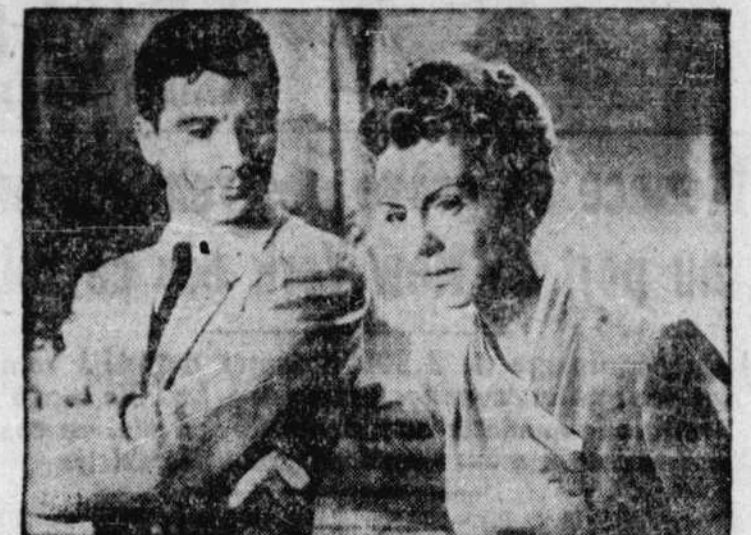
Gilbert Gil et Renée Saint-Cyr dans une scène dramatique de "Pierre et Jean", que le Saint-Denis mettra samedi, à l'affiche.