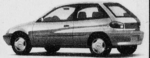
Geo Metro Coupe