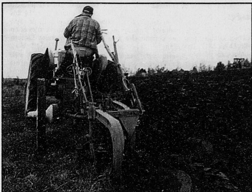
Le 76e concours de labour du Club des laboureurs de Stanstead a été couronné de succès.

Le nom des gagnants de la compétition de samedi sera dévoilé samedi prochain à Hatley lors de la tenue de la soirée annuelle de l'organisme.