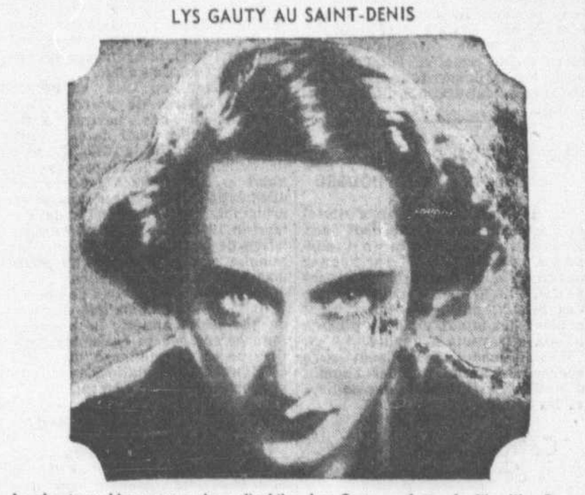
La chanteuse bien connue des radiophiles, Lys Gauty, vedette du film "La Goualeuse", à l'Affiche du Saint-Denis.