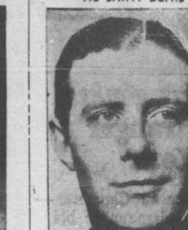
Henri Garat, populaire acteur français, vedette de film "Au Soleil de Marseille", aujourd'hui au Saint-Denis.