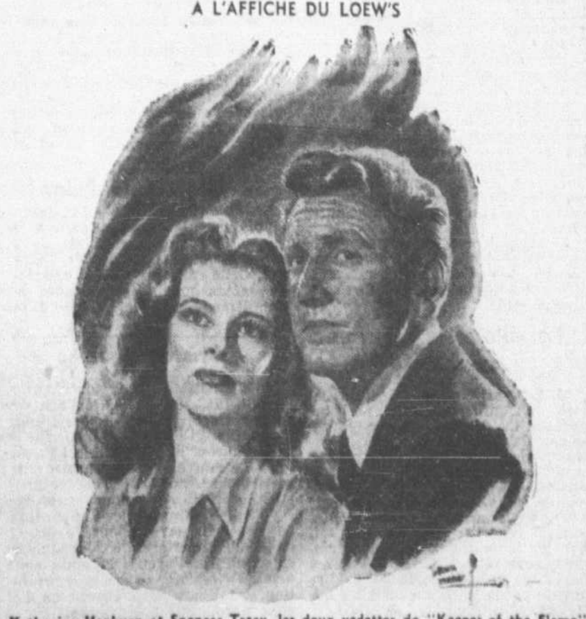
Katherine Hepburn et Spencer Tracy, les deux vedettes de "Keeper of the Flame", qui passe cette semaine à l'écran du "Loews".