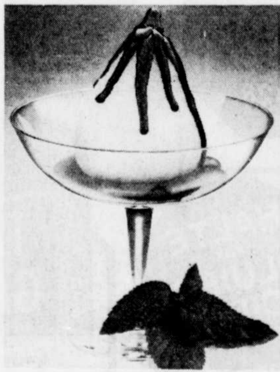
La poire au chocolat; une des nombreuses façons de savourer ce fruit qui nous vient principalement d'Ontario.