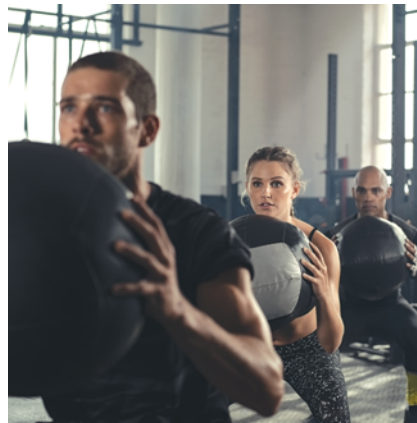
1 salle de CrossFit et 1 salle de vélo