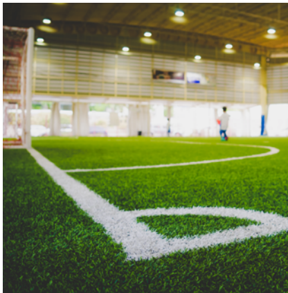
4 surfaces synthétiques