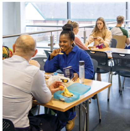
Espace commercial et aire d'alimentation