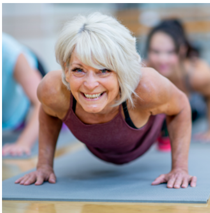
2 grandes salles multifonctionnelles