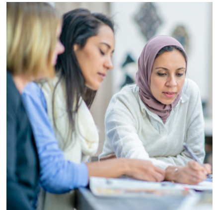
Bureaux et entreposage pour les organismes