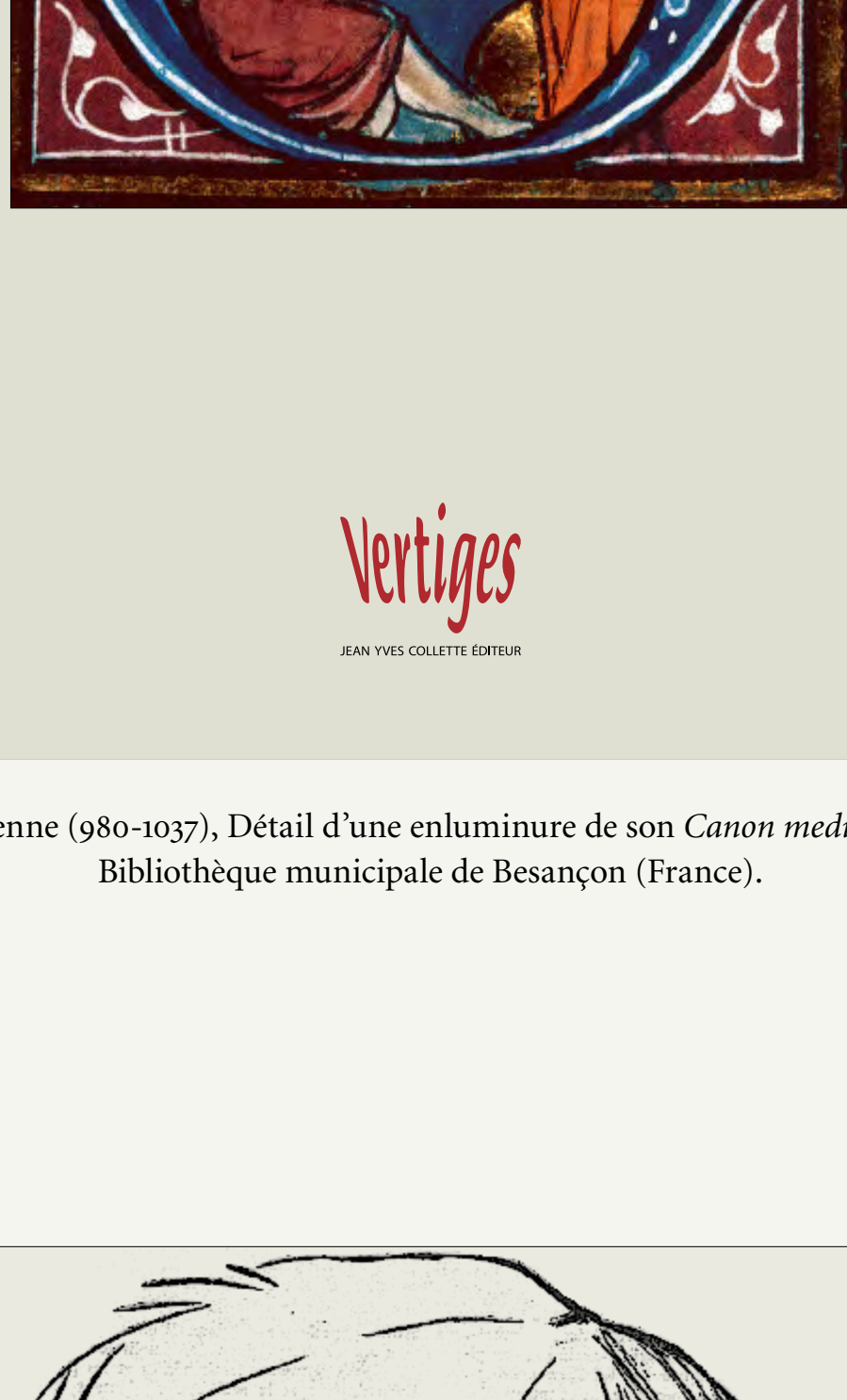
Avicenne (980-1037), Détail d'une enluminure de son Canon medicinae , Bibliothèque municipale de Besançon (France).