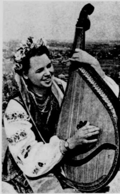
Cette jeune Ukrainienne joue du «bandura». La série Reportage nous présentera précisément, le lundi 12 décembre à 9 h. 30 du soir, un réseau français de télévision de Radio-Canada, un documentaire sur les Ukrainiens de l'Ouest canadien. Intitulé Steppes illimitées, ce reportage a été réalisé par Georges Francoeur.