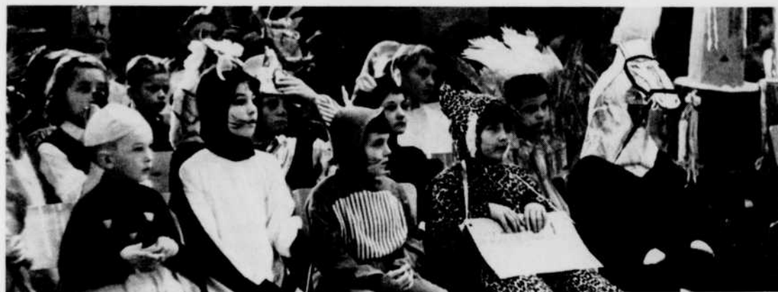
Voici une assistance fort insolite ! Mais seuls des enfants savent jouer sérieusement...