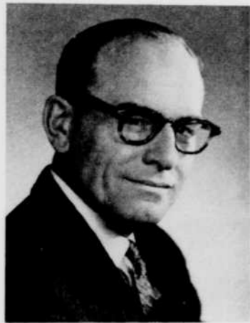
M. Marcel Trudel

Cette page d'histoire que nous avons oubliée, M. Marcel Trudel,