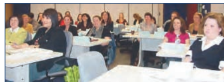
Quelques-uns des trente participants à une formation des personnes-ressources donnée à Québec en mars 2009

prévoit un volet de suivi et de soutien afin qu'une fois formés, les participants puissent bien assumer leur rôle de « référence » dans leur milieu respectif. Ainsi, selon les demandes, des sessions de mise à jour seront données, en collaboration avec les agences. D'ailleurs, le MSSS et le Curateur public réfléchissent sur les moyens les plus efficaces pour assurer la stabilité et la pérennité de cette formation.