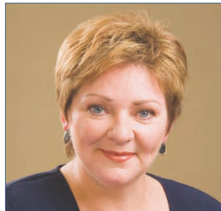
Diane Lavallée Curatrice publique du Québec

Qui est le Curateur public, quelle est son histoire et quels sont ses défis d'avenir?