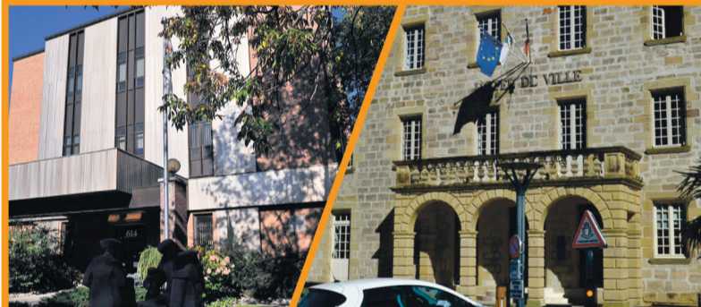
Mairie de Brive