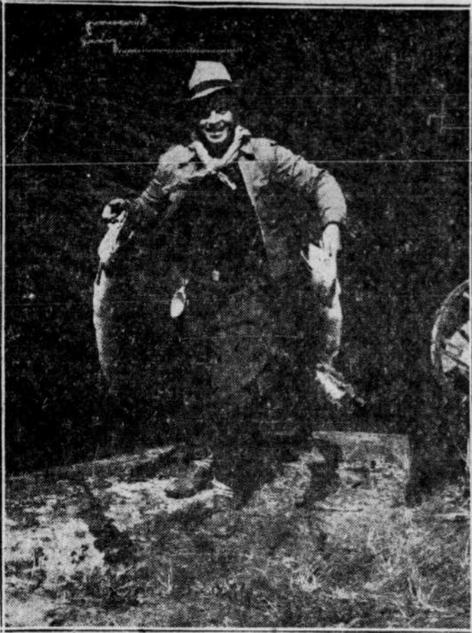
Pêcheurs sportifs, les innombrables lacs du nord, débarrassés de leur carapace de glace, vous attendent. C'est le temps plus que jamais de lancer le dévolu comme vient de le faire ce pêcheur à la mine réjouie.