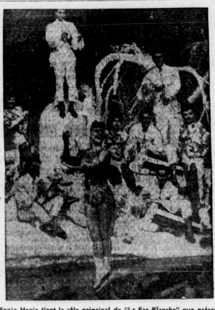
Sonja Henie tient le rôle principal de "La Fee Blanche" que présente cette semaine le cinéma Champlain, en exclusivité montréalaise.