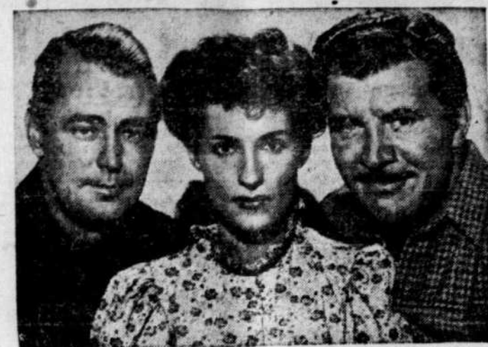
On reconnaît Alan Ladd, Brenda Marshall et Robert Preston, qui tiennent les principaux rôles de "Whispering Smith" que présentera le Princess à partir de vendredi.