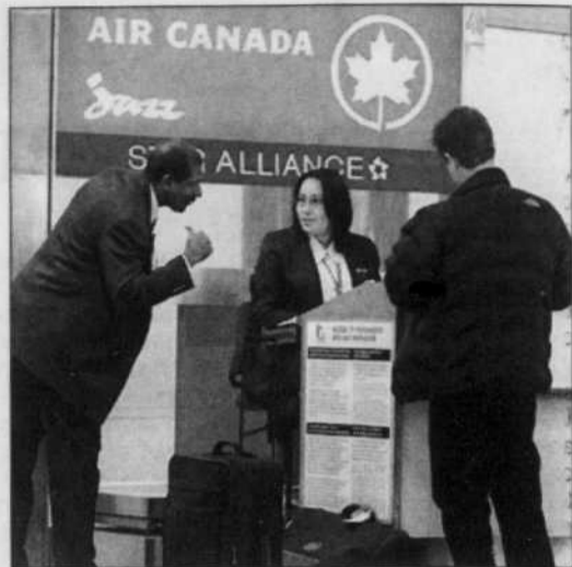
Les agents de bord d'Air Canada Jazz ont approuvé à 82 % un accord de six ans.