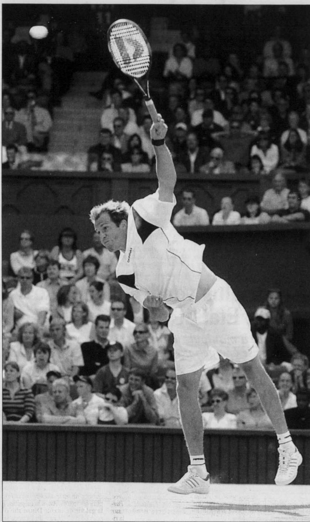
Battu 7-6 (7/4), 7-6 (7/1), 7-5, Greg Rusedski menait 5-2 et 30-15 contre Andy Roddick dans le troisième set quand un spectateur a crié «out»...