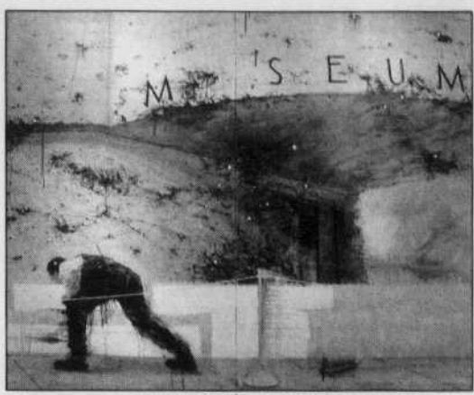
DANIEL GAGNÉ GALERIE MADELEINE LACERTE La Compagnie des blancs-couvreurs , huile sur toile, 2003.

Au milieu de la galerie, BGL recrée l'embuscade d'un véhicule tout-terrain. L'installation peut paraître déroutante dans un pareil contexte mais renforce néanmoins les propos écologiste de ces artistes de Québec. Le rapport entre nature et culture dérange