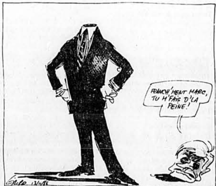
Qui a dit que les couteaux volent bas?

Les premiers ministres provinciaux rencontreront leur homologue fédéral cette semaine à Vancouver. A deux pas de Victoria où s'est déjà tenue, au début des années soixante-dix, une conférence restée célèbre et qui a failli déboucher sur un accord constitutionnel. M. Bourassa s'apprete à y amorcer d'éventuelles nouvelles discussions à ce sujet.