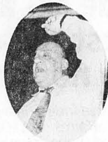
Camillien Houde: victoires et défaites spectaculaires.

Même si, dimanche dernier, le raz-de-marée du RCM a presque éliminé toute opposition au sein du conseil municipal, on aurait tort de l'imputer au soi-disant «royalisme» des Montréalais. Il faudrait se rappeler que, si Jean Drapeau a survécu à un plébiscite semblable en 1970, il n'y a pas si longtemps, à Québec en 1976, Robert Bourassa a subi sa plus retentissante défaite. Juste après avoir connu, trois ans plus tôt, une victoire sans précédent dans notre histoire politique.