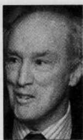
Pierre Elliott Trudeau

Le bref communiqué envoyé à la presse indique que «Justin et Sacha Trudeau confirment que leur père, le très honorable Pierre Elliott Trudeau, ne se porte pas très bien. Sa famille l'entoure et il reçoit une attention suivie de ses médecins. [...] Par courtoisie, monsieur Trudeau et sa famille demandent que leur intimité soit respectée et ne feront pas de commentaire supplémentaire pour le moment.»