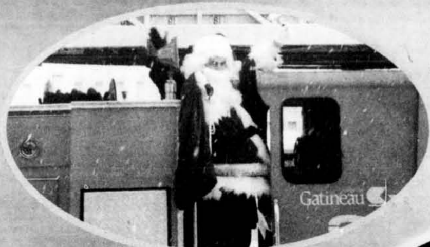
Arrivée du Père Noël en camion de pompier pour accueillir le don des enfants de l'école Montessori de Chelsea.