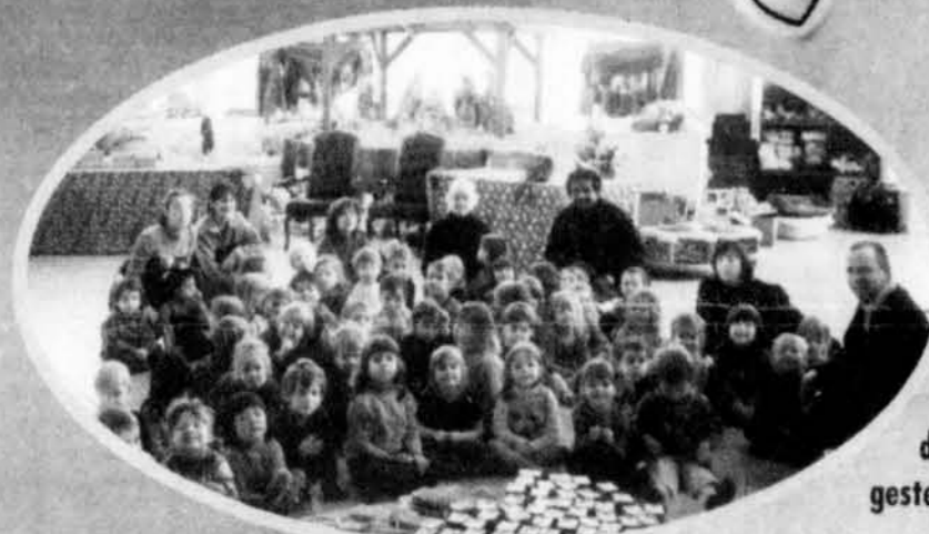
Merci à la direction et aux élèves de l'école Montessori de Chelsea pour votre geste de solidarité