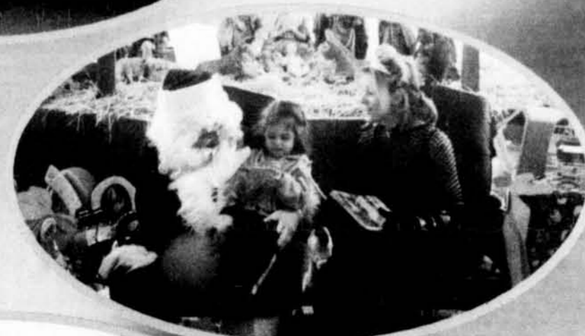
Le père Noël et la fée des étoiles reçoivent un cadeau d'une amie de l'école Montessori de Chelsea.