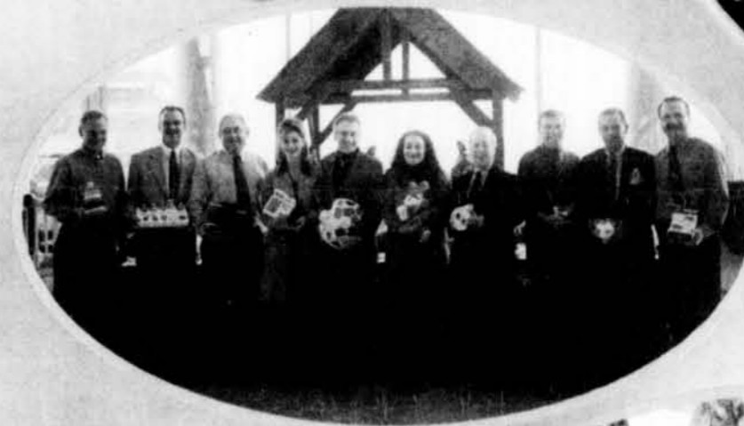
La direction de Toyota Gatineau vous remercie pour votre participation à la campagne.