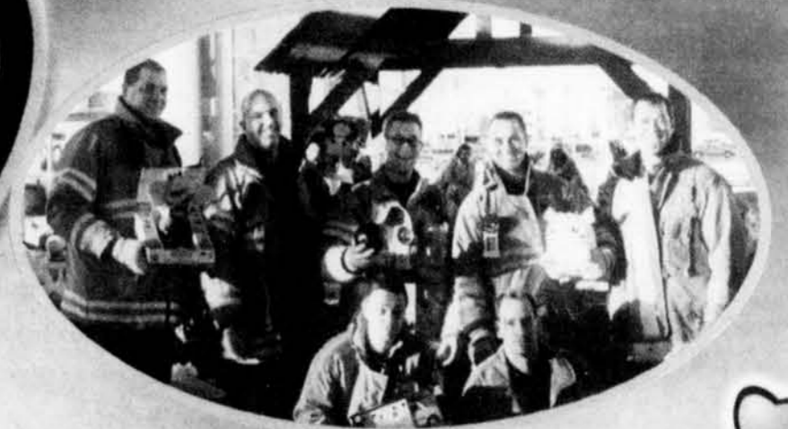
Les pompiers de Gatineau.

Les 20 gagnants des certificats-cadeaux d'une valeur de 100$ aux boutiques « Les petits Copains » et « Clément Ltée » des promenades de l'Outaouais.