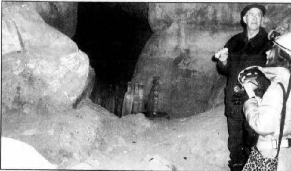
La Caverne Laflèche de Val-des-Monts dévoile ses attraits naturels aux nombreux visiteurs qui s'y rendent, comme ce fut le cas ici pour des journalistes de l'Ontario qui ont été guidés par Euclide Villeneuve. On remarque également la présence de stalagmites de glace.

alors formés avec les personnes qui s'y présentent seule ou en famille. Pour en savoir davantage, composez le 457-4033.