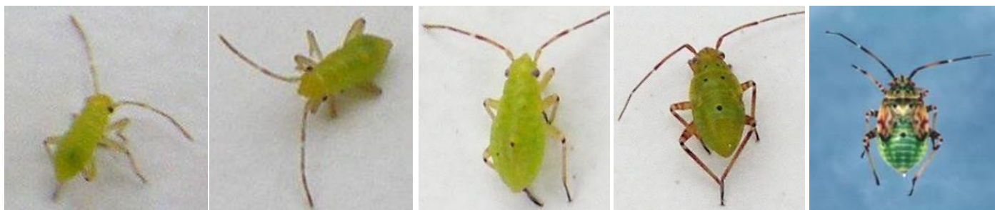
1 er stade larvaire