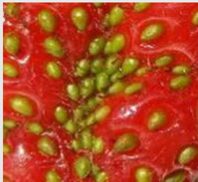
Dommmage de punaise

La malformation des fraises peut se confondre avec une mauvaise pollinisation. Dans ce dernier cas, on observe de petits akènes à travers de plus gros, tandis que les dégâts de la punaise montrent des akènes de la même grosseur, même s'ils sont regroupés. Le gel partiel des fleurs peut aussi causer des déformations de fruits.