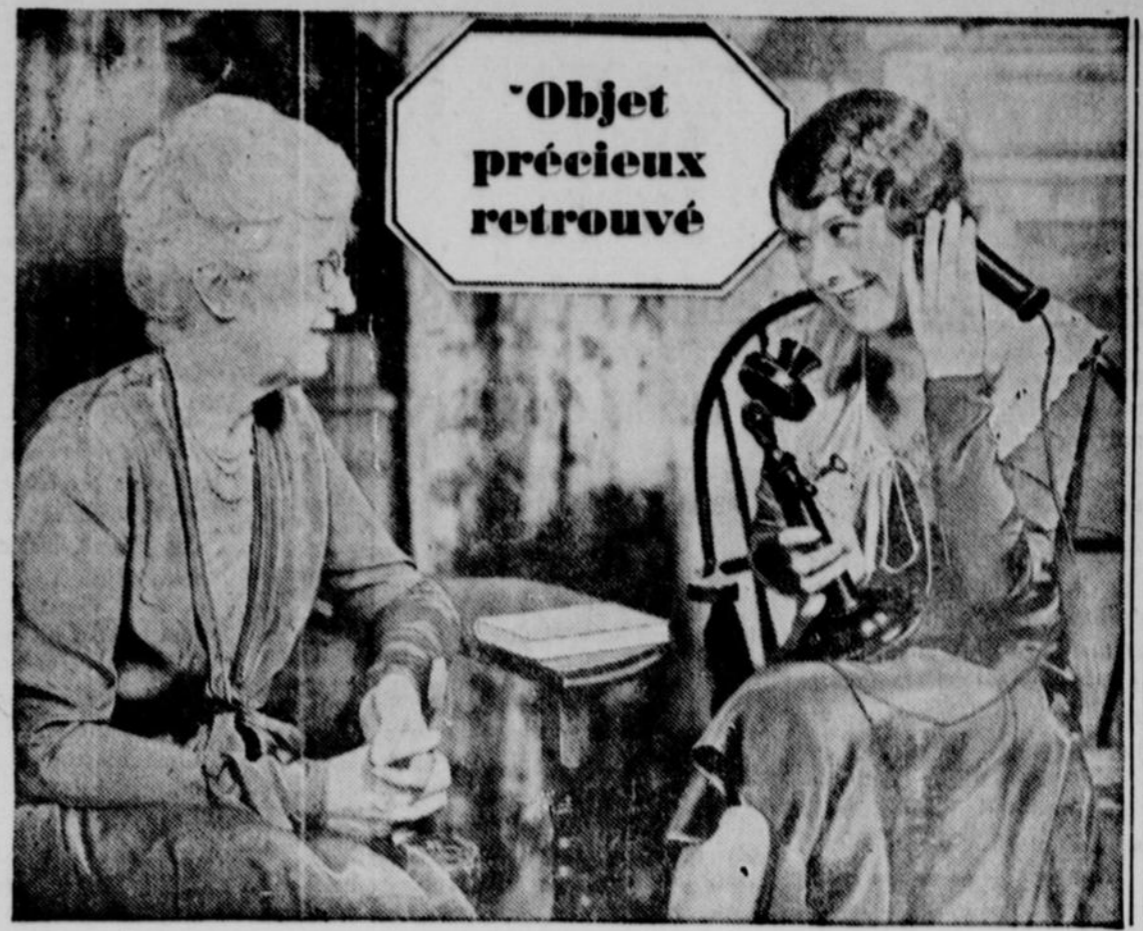
'Objet précieux retrouvé