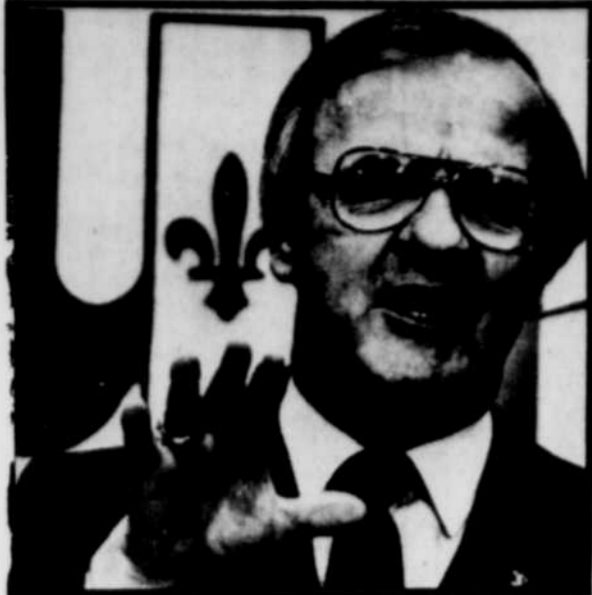
Roch LaSalle est le 11e successeur de Maurice Duplessis et le 7e à être choisi sans congrès à la chefferie.