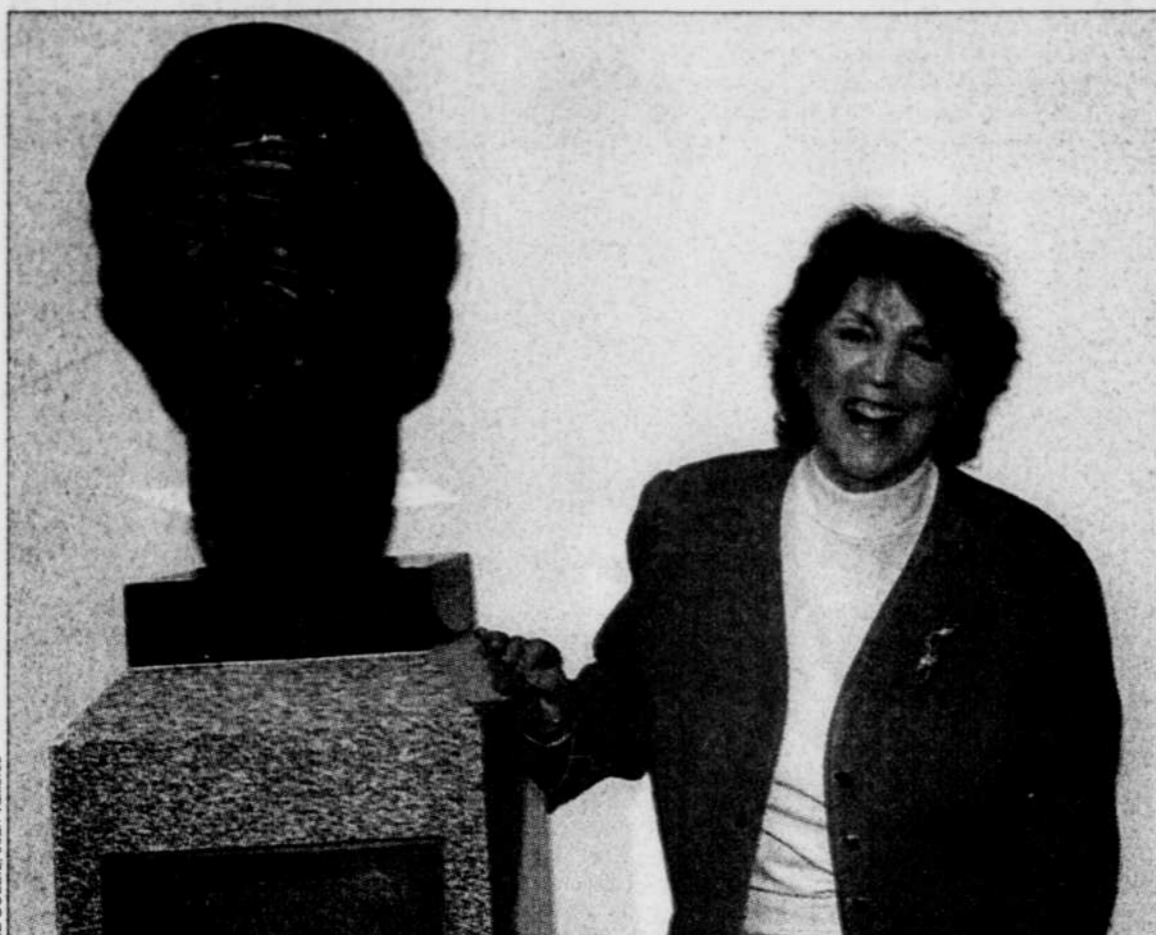
L'écrivaine Madeleine Ferron aux côtés du buste en bronze de son défunt mari, le juge Robert Cliche.