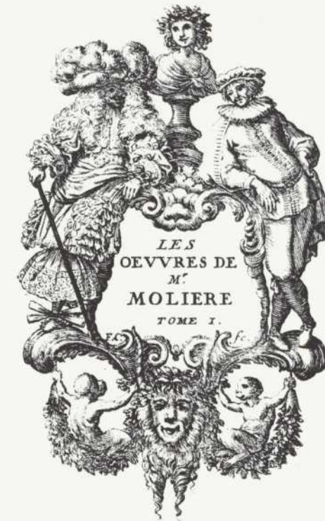
Frontispice des œuvres de Molière, gravé par F. Chauveau, pour l'édition de 1666. Molière y est figuré dans les costumes de Sganarelle et Mascarille.