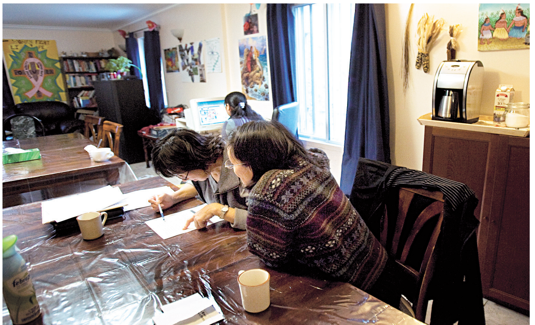
Les femmes autochtones ont un refuge à Montréal.