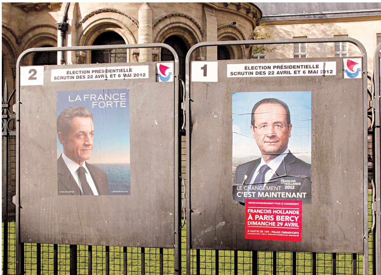
Le président français, qui sera élu demain, devra s'attaquer en priorité à l'économie.

Les lendemains du 6 mai ne seront pas roses. C'est une des seules certitudes de cette élection. D'autant plus que certaines entreprises auraient reporté des mises à pied depuis plusieurs semaines pour cause de campagne électorale. On sait aussi que, depuis la perte de son triple A, la France est sous surveillance des principales agences de notation. Nicolas Sarkozy n'a d'ailleurs cessé d'annoncer une situation comparable à celles de la Grèce et de l'Espagne en cas d'élection des socialistes. Nous ne sommes cependant plus en 1981, alors que François Mitterrand arrivait au pouvoir avec un programme négocié avec le Parti communiste. La nomination à Matignon de Lionel Jospin en 1997 n'avait pas créé le moindre soubresaut à la Bourse. Il faut dire qu'à l'époque, la croissance était au rendez-vous.