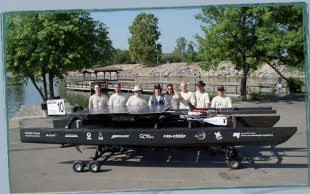
Projet Praxis Photon - École de technologie supérieure Concours Solar Splash en Arkansas aux États-Unis