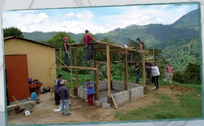
Projet Passerelle Eldorado - CJE Shawinigan Construction de maisons pour familles défavorisées au Guatemala