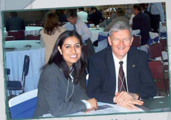
Projet Curriculum Mentorat La Rencontre d'affaires France-Mexique-Québec