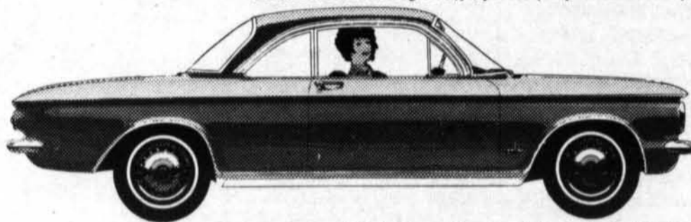
Le coupé Club Monza Corvaire 64 (empattement 108")