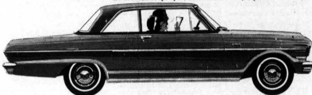
Le sedan Nova Chevy II 64, 2 portes (empattement 110")