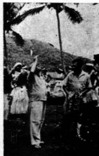
Chaque mercredi matin, après le long métrage de 11 heures, Radio-Canada présente "Visite à nos cousins", avec Jacques Languirand.