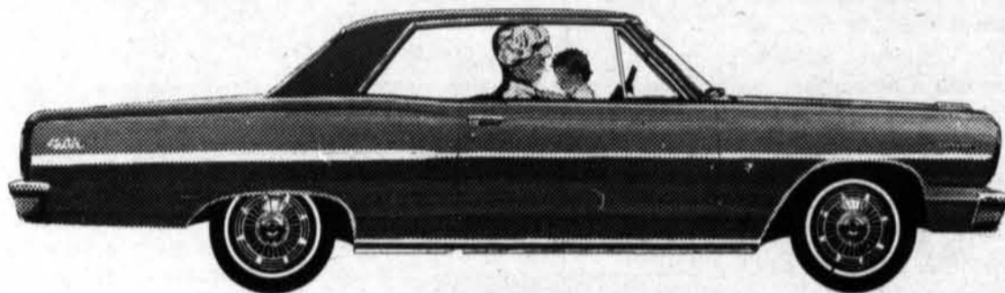
Le nouveau coupé sport Malibu Chevelle (empattement 115")