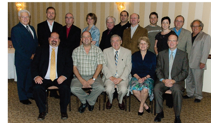
Le conseil d'administration 2010

Le conseil d'administration du comité sectoriel, élu annuellement, est composé de dix représentants d'entreprises, de cinq représentants associatifs de salariés syndiqués, de cinq représentants associatifs sectoriels ou professionnels, d'un représentant de la Commission des partenaires du marché du travail à titre d'observateur et du directeur général du comité. Ces deux derniers n'ayant pas droit de vote.