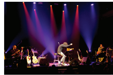
Une performance haute en couleur

Ainsi, en informant les futurs travailleurs et les agents d'Emploi-Québec des possibilités de carrière dans notre secteur, cela nous aura permis de contribuer, d'une part, à la réduction du taux de chômage, et d'autre part, à la valorisation du secteur auprès de la relève.