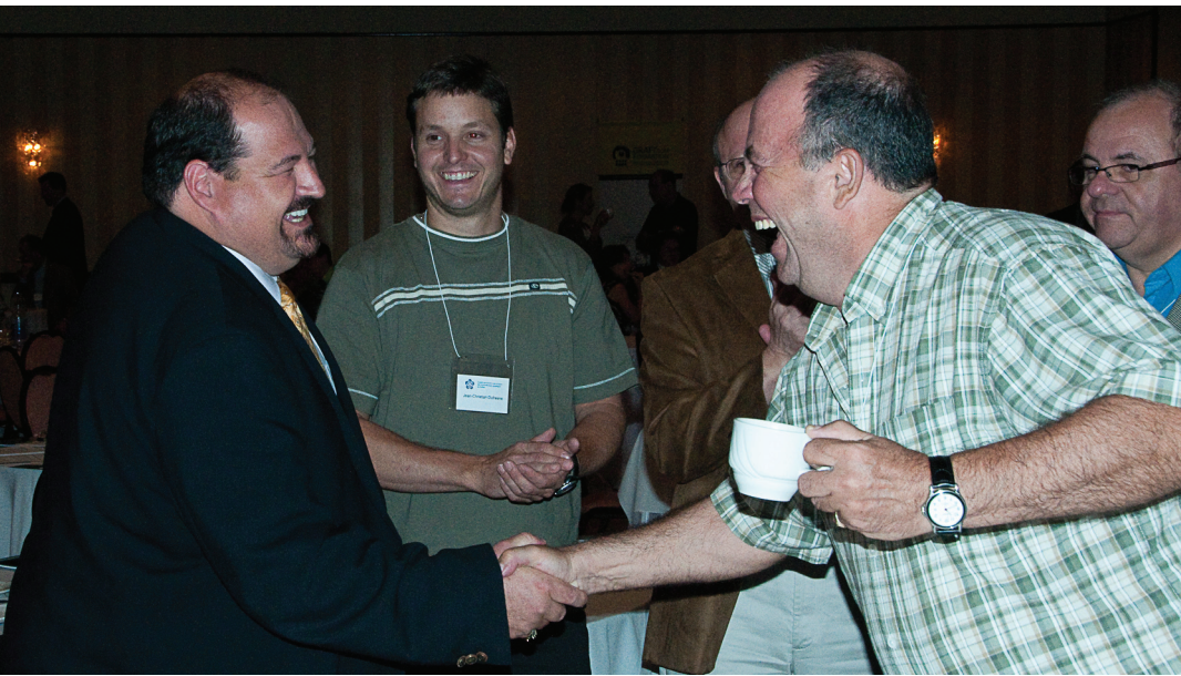
Des rencontres fortes en émotions