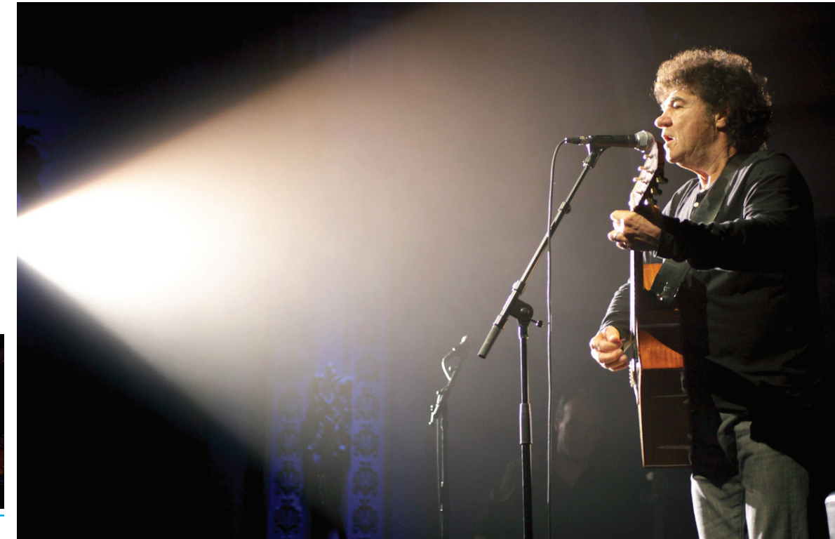
Robert Charlebois au gala Imprime-Emploi.