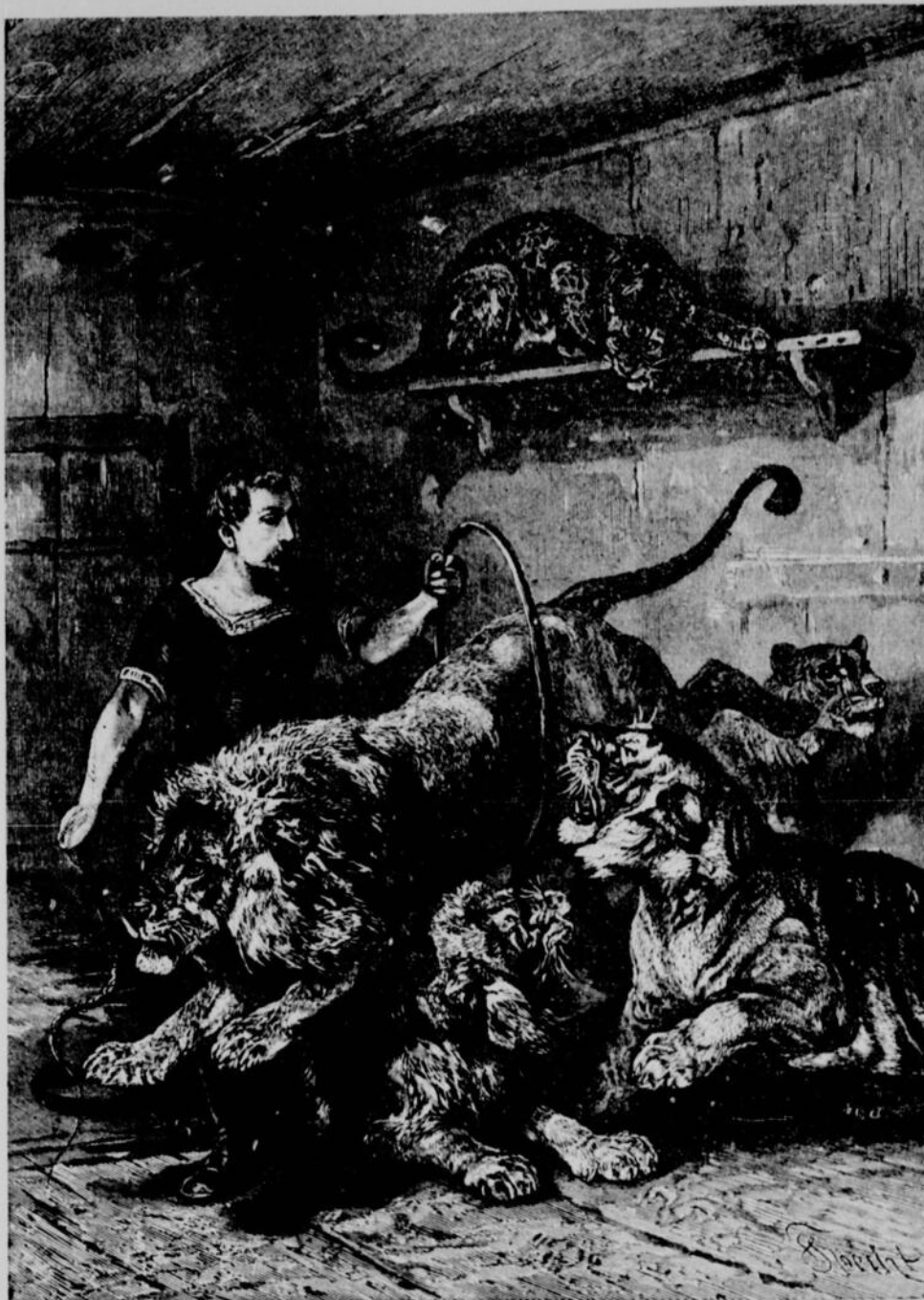
L'APPROVOISEMENT DES FAUVES.—LE DRESSAGE

Les lions des ménageries sont nés pour la plupart dans les cages, de parents qui souvent, eux-mêmes, y