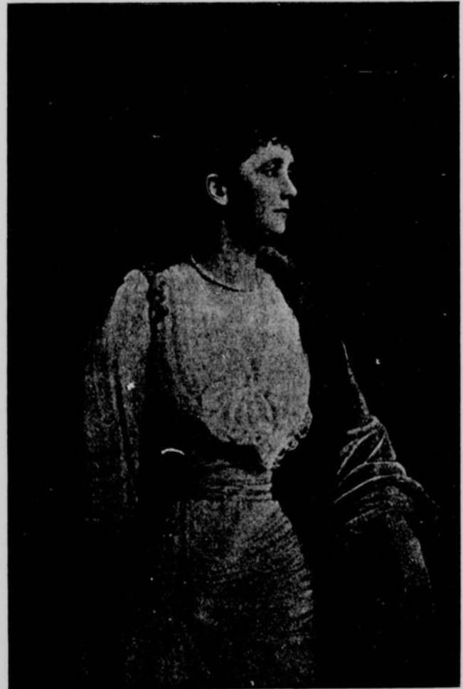
La comtesse Minto