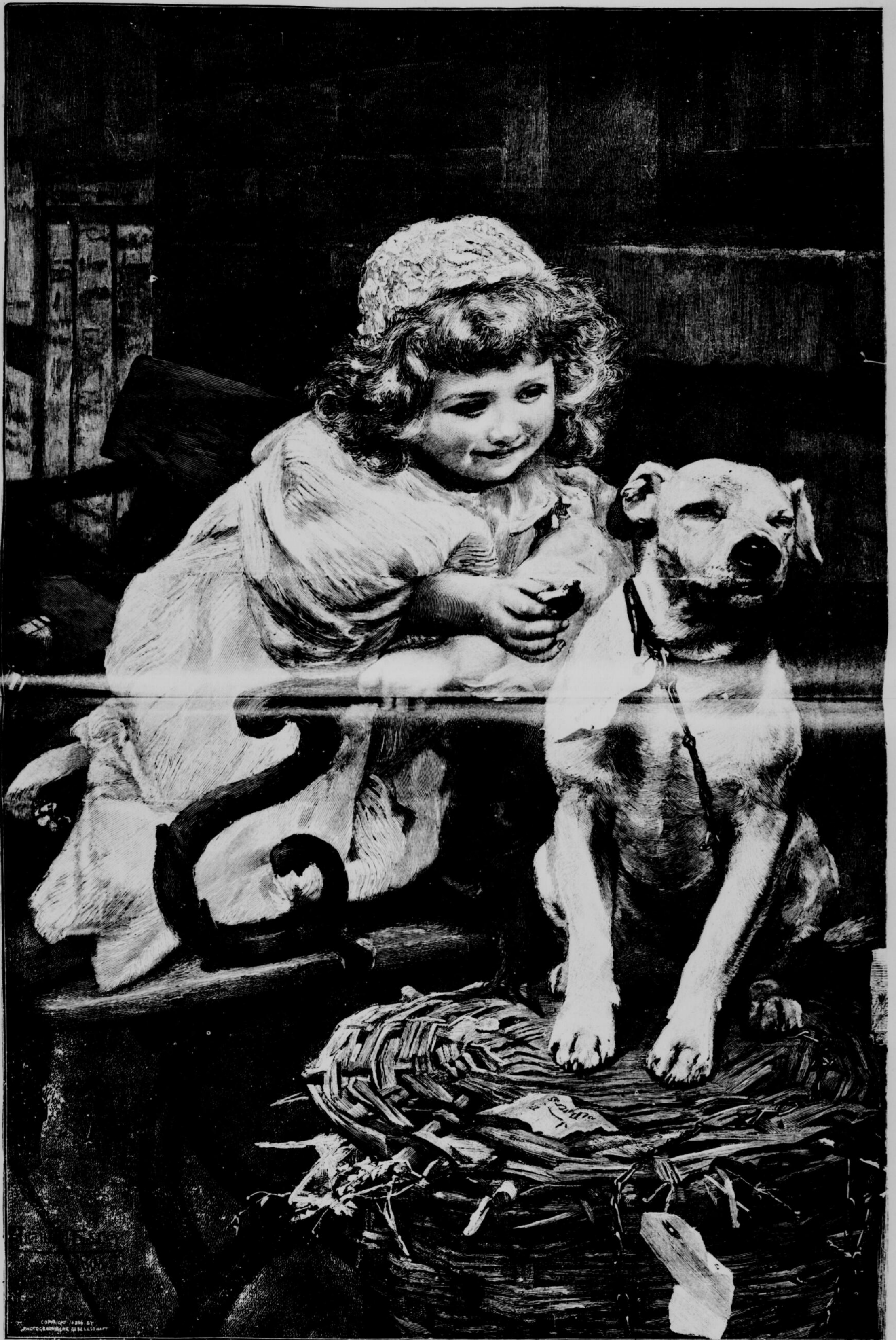
BEAUX - ARTS. — LE GROS DÉGOUTÉ