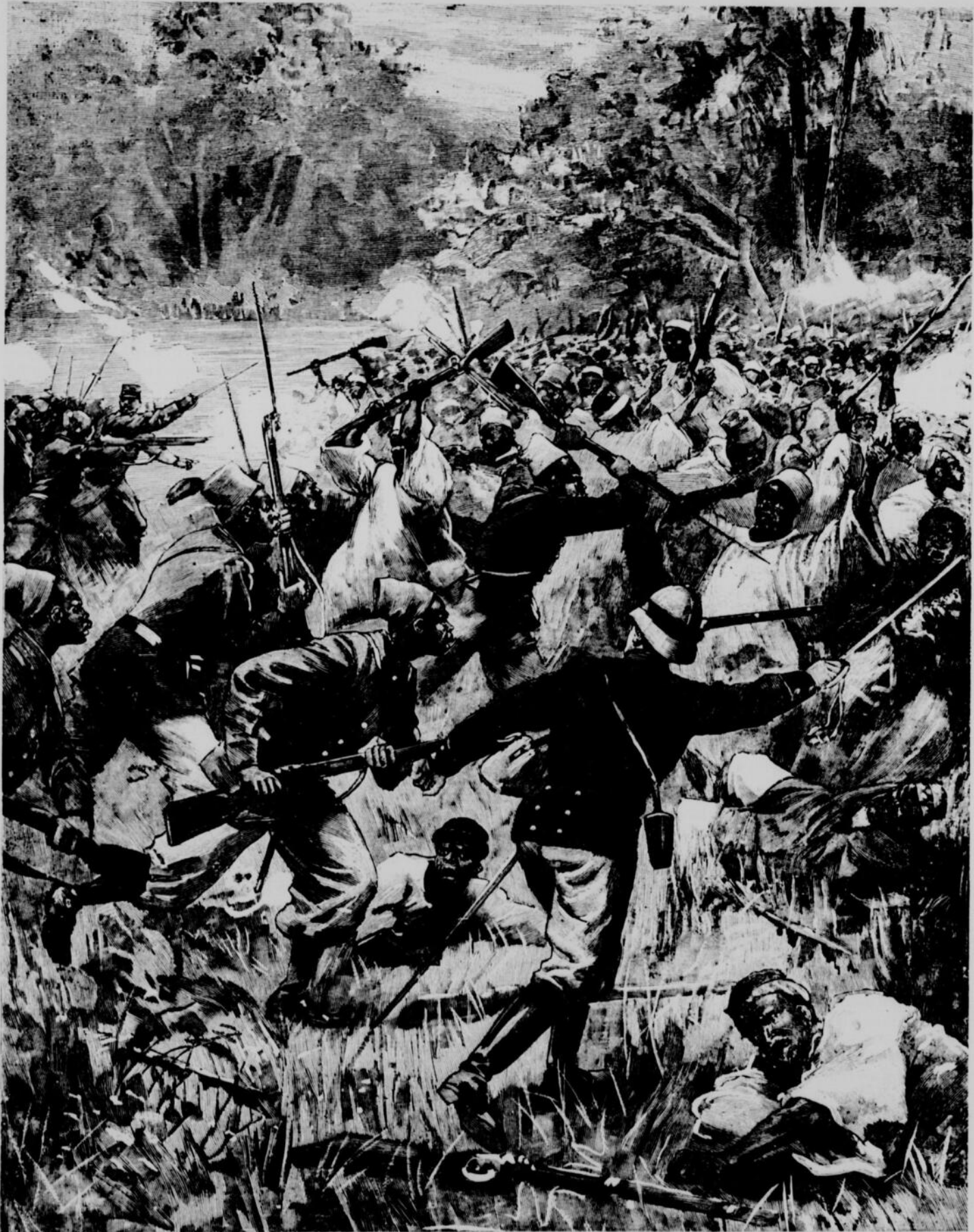
LES FRANÇAIS AU SOUDAN. — La déroute de Samory

La ligne, par insertion - - - 10 cents Insertions subséquentes - - - 5 cents Tarif spécial pour annonces à long terme