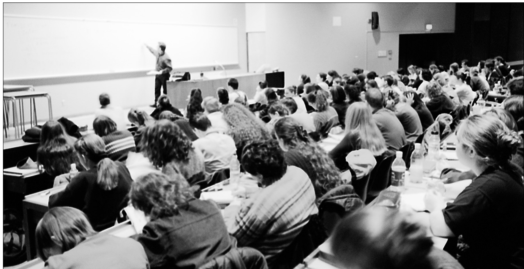
Le nombre d'étudiants inscrits à l'un des 30 programmes de certificat de la faculté d'éducation permanente à l'Université de Montréal a fait un bond de 20 % depuis deux ans.

« La relation entre la formation initiale et la formation continue est