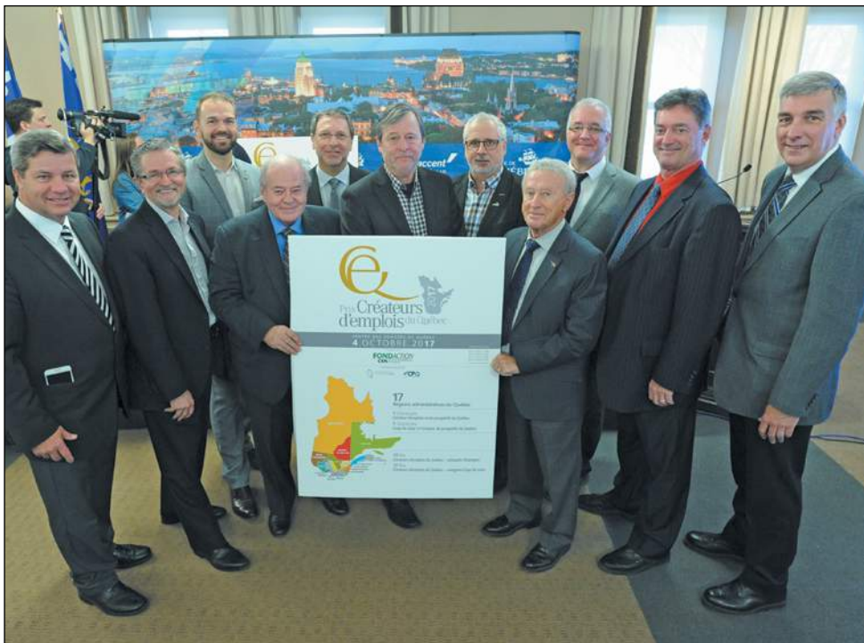
Les gouverneurs et hauts dirigeants des parcs industriels posent fièrement devant cette signature appelée à se faire connaître partout au Québec.