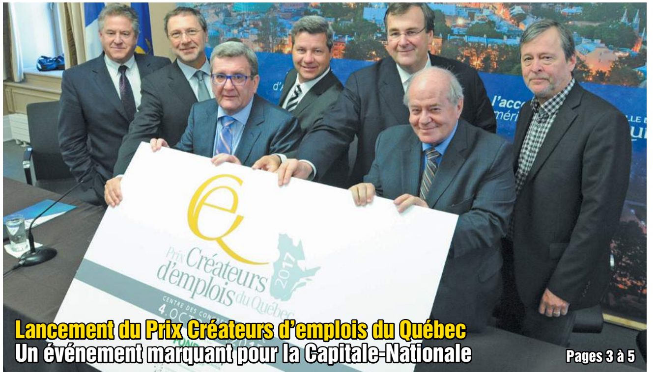
Lancement du Prix Créateurs d'emplois du Québec Un événement marquant pour la Capitale-Nationale