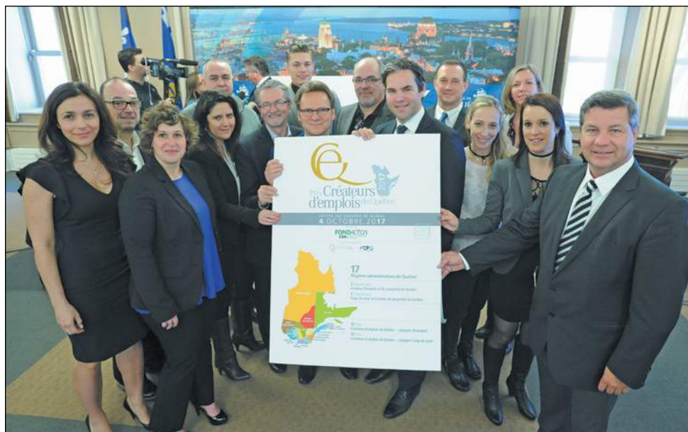
Tous les partenaires de l'événement, réunis lors du lancement qui s'est tenu à l'hôtel de ville de Québec.