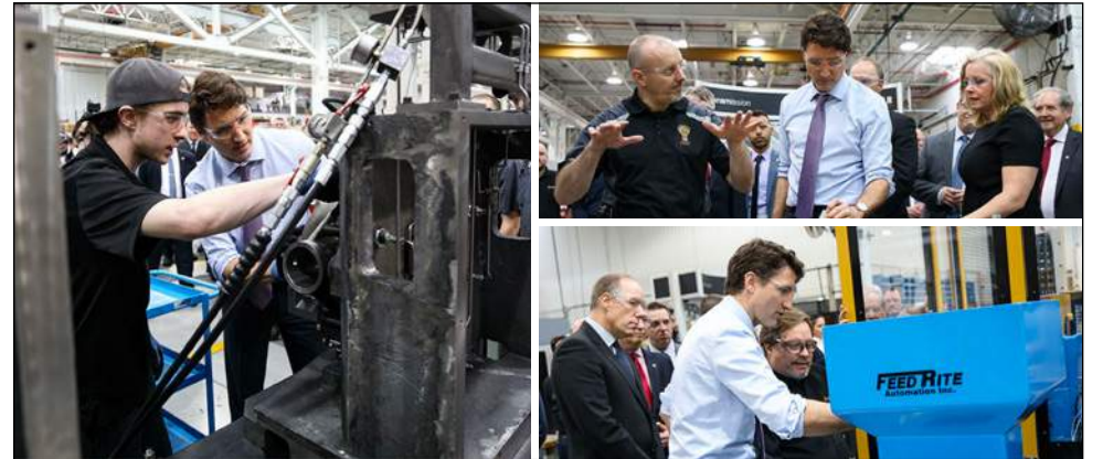
Le premier ministre du Canada, M. Justin Trudeau, a procédé à la visite du centre d'excellence en fabrication Frank Hasenfratz et s'est montré impressionné par la haute technologie de l'entreprise.