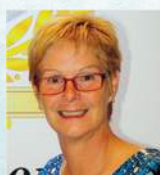
FRANCE LOCAS, Fondation québécoise du cancer