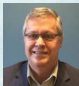
ALAIN LEPAGE Journal.ca