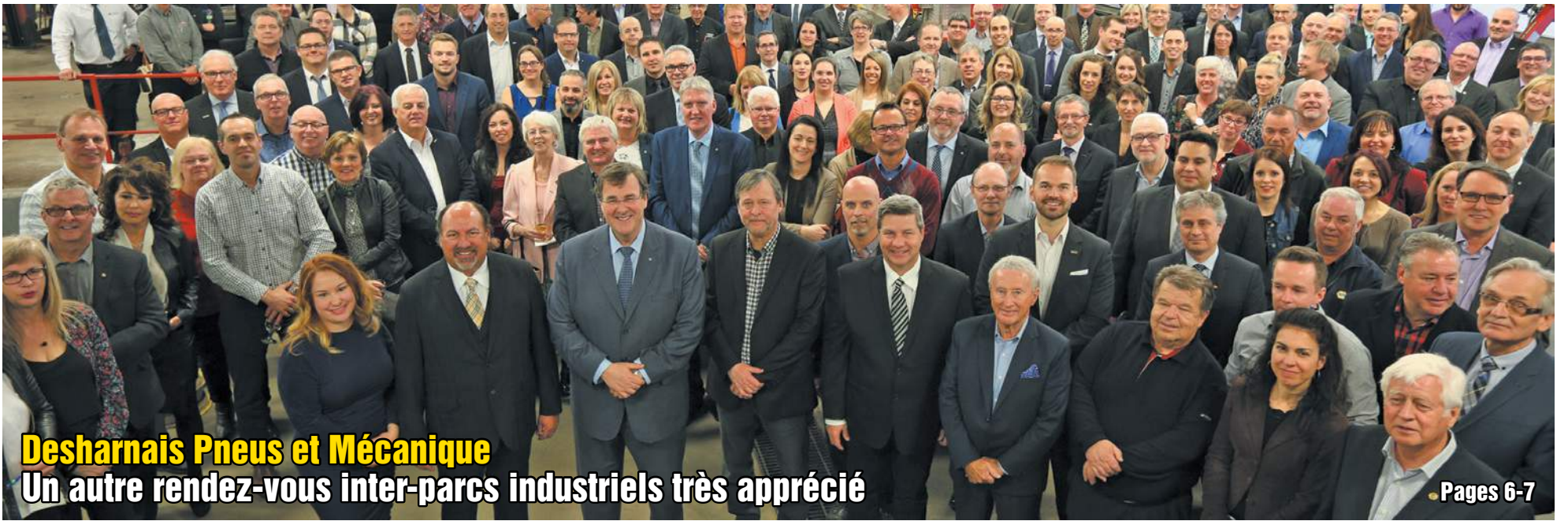
Desharnais Pneus et Mécanique Un autre rendez-vous inter-parcs industriels très apprécié