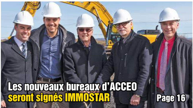
Les nouveaux bureaux d'ACCEO seront signés IMMOSTAR