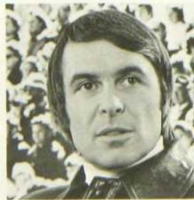
«Wimbledon 1977». Demi-finale de tennis chez les hommes, avec