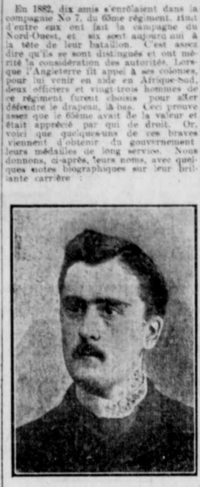
M. LE MAJOR OSCAR EVANTUREL, 2e Régiment d'Infanterie de Québec.

Des officiers supérieurs de régiments canadiens-français de Québec et de Montréal reçoivent la récompense méritée par leur dévouement à la défense de l'Empire et des colonies