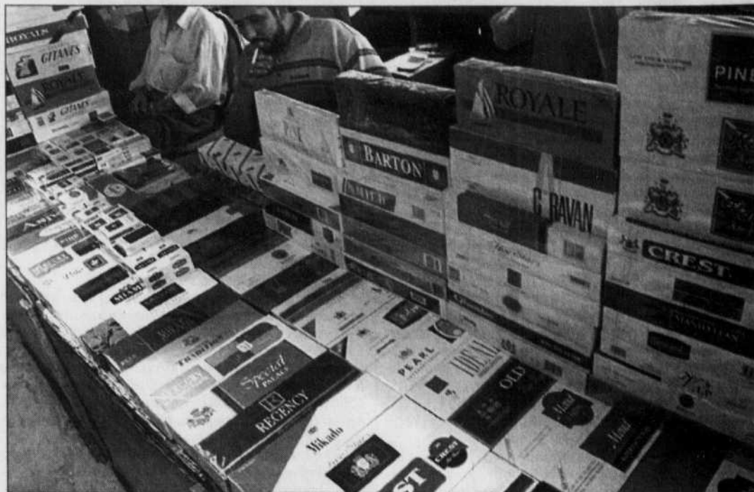
L'entreprise de Philip Morris paie surtout pour financer la lutte contre la contrefaçon par les administrations et les services de police des États membres de l'UE.

Même si l'UE avait été déboutée en 2004, les juges américains estiment qu'un pays étranger ne pouvait obtenir le recouvrement de recettes devant une juridiction américaine, une conséquence d'une «loi sur le revenu» du XVIII e siècle, d'origine britannique,