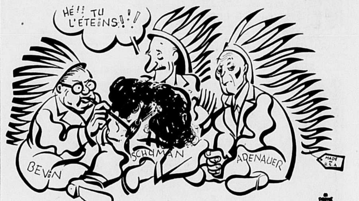
Le haut fourneau de la paix