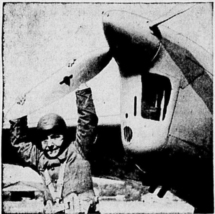
L'extraordinaire fantaisiste Georges Milton, qui revient au Saint-Denis, dès samedi, dans la plus désopilante comédie de la saison, "Les deux Combinards".